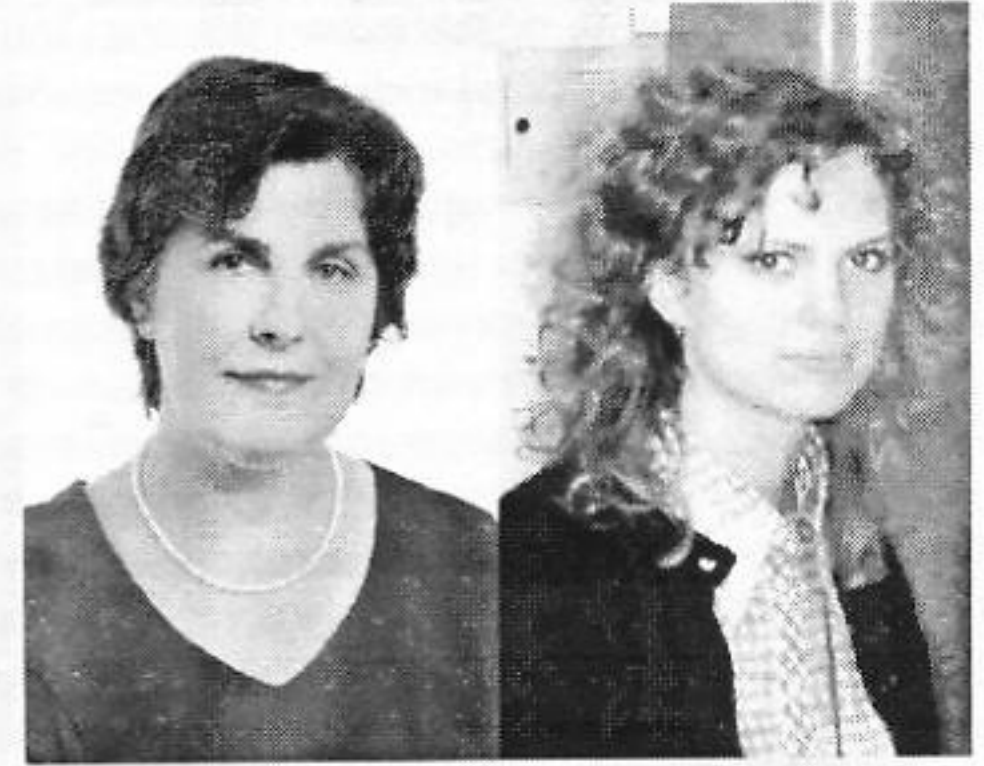
Галоўны бібліёграф НДА кнігазнаўства НББ Галоўны бібліёграф НДА кнігазнаўства НББ

У свеце найноўшых інфармацыйных тэхналогій і парадаксальнага адраджэння цікавасці да рарытэтных кніг і ўнікальных кніжных калекцый нам падаецца важным вопыт працы з гістарычным кнігазборам акадэміка Яўхіма Фёдаравіча Карскага (1861–1931), сусветна вядомага філолага, ураджэнца Беларусі і патрыярха новай для навуковага свету навукі – беларусазнаўства.