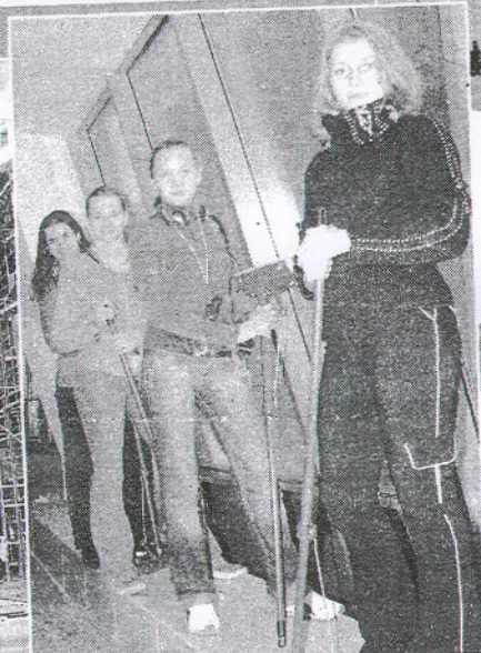
Высоко оценивая научную работу кафедры