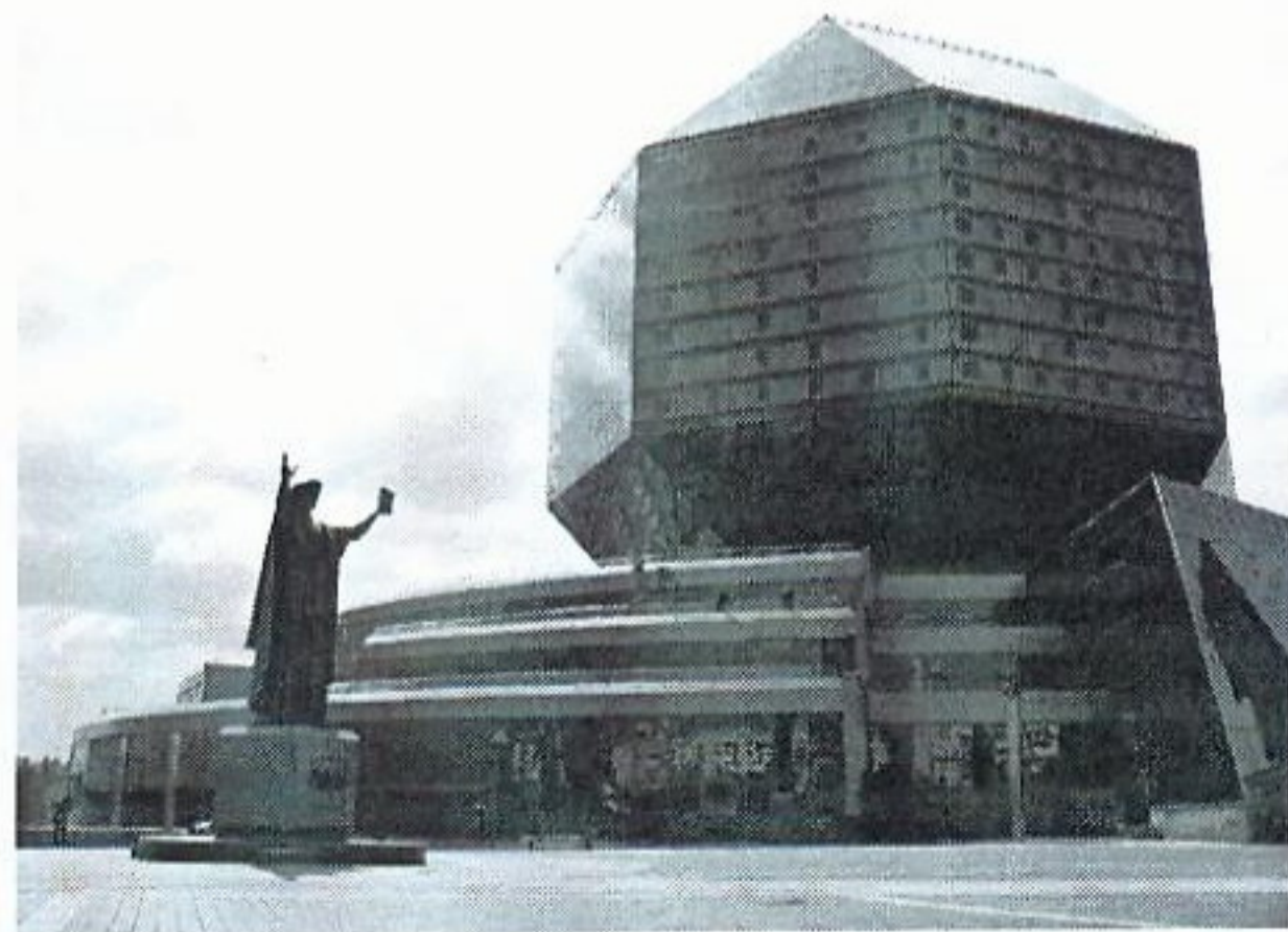
Мал. 1. Нацыянальная бібліятэка Беларусі, г. Мінск

Масівы святлопразрыстых канструкцый, выкарыстання пры гарманізацыі складзенай забудовы, цудоўна вырашаюць кампазіцыйныя праблемы, выкарыстоўваючы прыём арганізацыі ў прасторы функцыянальных межаў камфартабельных транспарэнтных абалонак пры захаванні агульнай візуальнай цэласнасці ўдалых кампазіцый. У той жа час пры актывізацыі сродкаў мастацкай выразнасці (узмац-