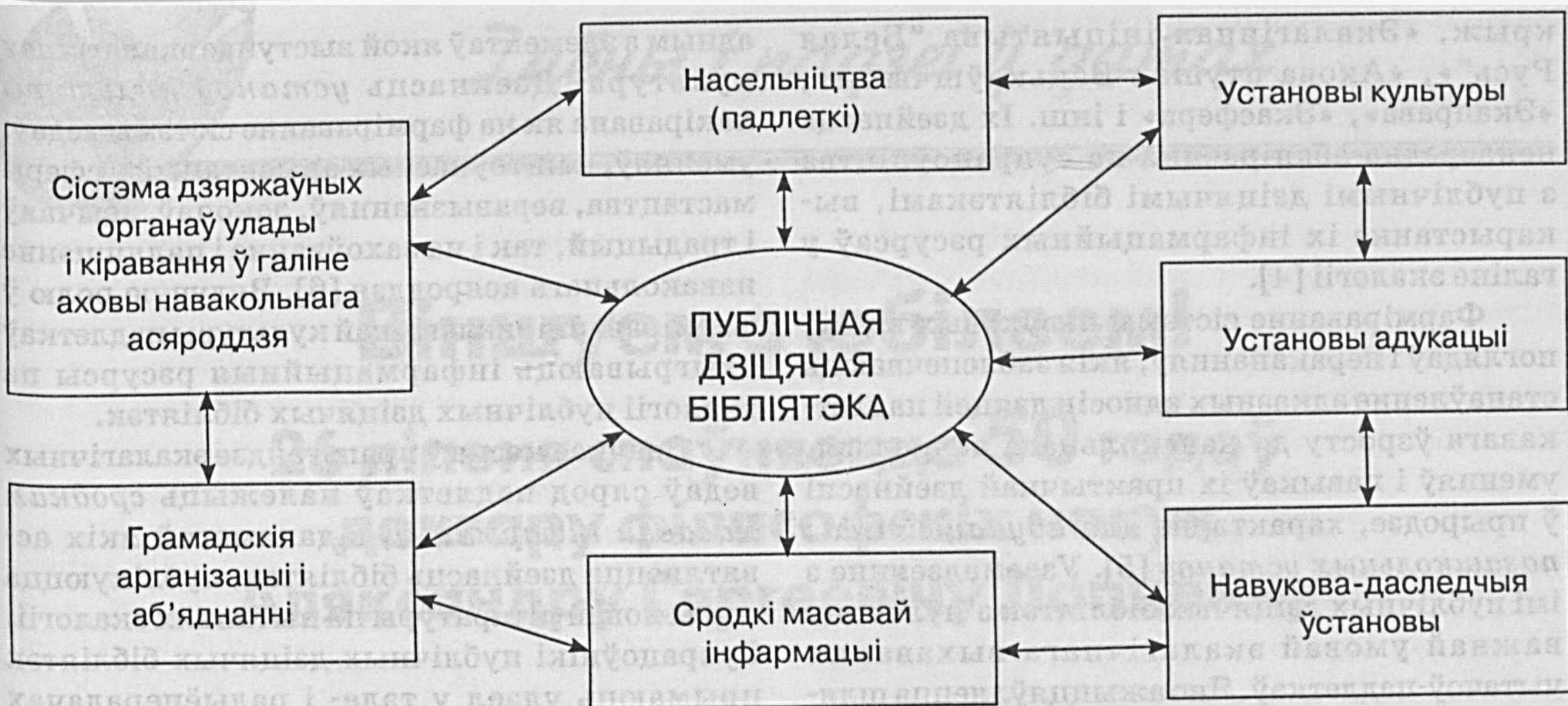
Малюнак 2 – Мікраасяроддзе публічнай дзіцячай бібліятэкі ў кантэксце экалагічнага выхавання падлеткаў

асяроддзя. Яму падпарадкоўваюцца Дэпартамент гідраметэаралогіі, Рэспубліканскае унітарнае прадпрыемства «Белгеалогія», навукова-даследчыя ўстановы (Цэнтральны навукова-даследчы інстытут комплекснага выкарыстання водных рэсурсаў, Беларускі навукова-даследчы геалагаразведчы інстытут, Беларускі навукова-даследчы цэнтр «Экалогія», Рэспубліканскі навукова-тэхнічны цэнтр дыстанцыйнай дыягностыкі прыроднага асяроддзя «Экамір»).