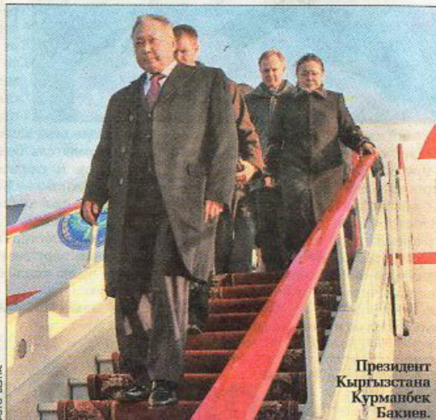
Президент Кыргызстана Курманбек Бакиев.