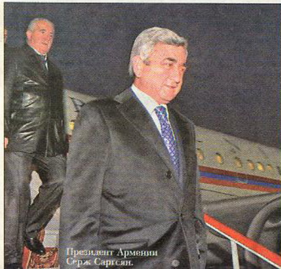
Президент Армении Серж Саргсян.

В Минск на заседание Межгоссовета ЕврАзЭС прибыли уважаемые Главы государств. Беларусь приветствует дорогих гостей!