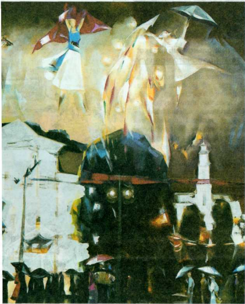
Л.Шчамялёў. "Музычны Віцебск". Алей.

Для мяне Віцебск не толькі "малая Радзіма", якая стала на многія гады крыніцай натхнення. Сёння Віцебск — як "культурную сталіцу" Беларусі, якая звязана з гісторыяй, музыкай, старажытнай архітэктурай, міжнароднымі фестывалямі мастацтваў і пленэрамі жывапісу, ведаюць ва ўсім свеце. Віцебск — гэта свята. Віцебск — гэта песня душы. Я імкнуўся паказаць мой, наш Віцебск з яго ратушай, цэнтральнай вуліцай і іншымі архітэктурнымі аб'ектамі праз музыку дажджу, праз сімвалічны натхнёны палёт чалавечых пахуццяў і эмоцый".