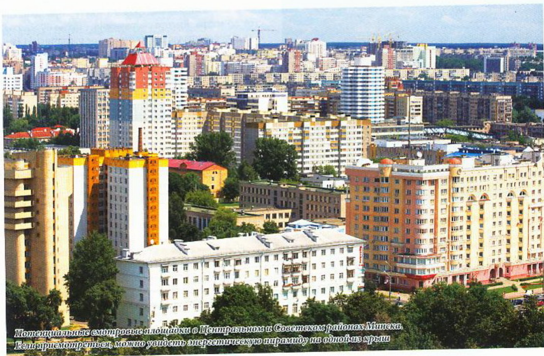
Потенциальные смотровые площадки в Центральном и Советском районах Минска. Если присмотреться, можно увидеть энергетическую пирамиду на одной из крыш

Естественно, это обзорные площадки правого берега Немана. Соответственно, смотреть вы будете на левый. Смотреть и восторгаться ни в коем случае нельзя одному. Вы обязательно расстроитесь, что самые лучшие эмоции переживете в одиночестве. И вместо умиротворения рискуете впасть в легкую меланхолию. Когда умиление достигнет своего пика, рекомендуется об этом рассказать своему спутнику/спутнице и поцеловать его/ее. ▲