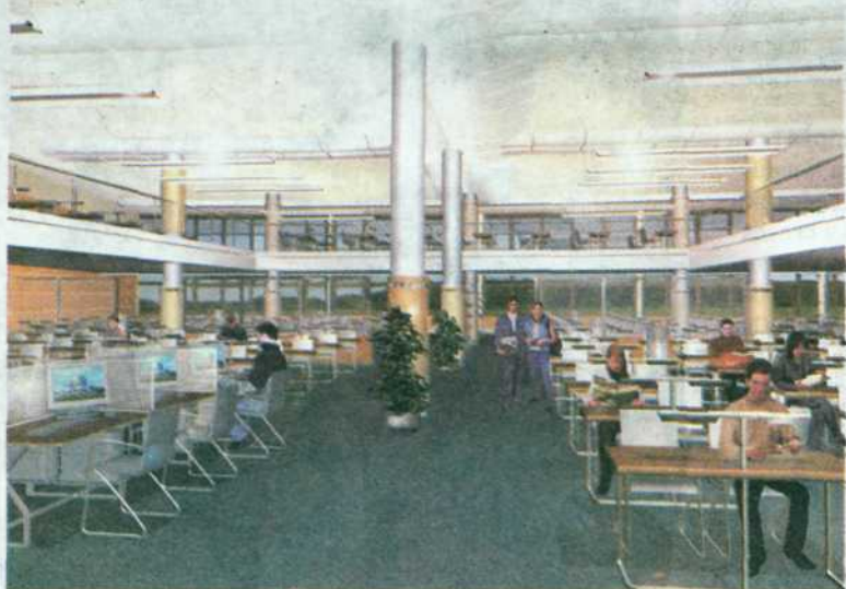
Праект інтэр'ера адной з чытальных залаў.