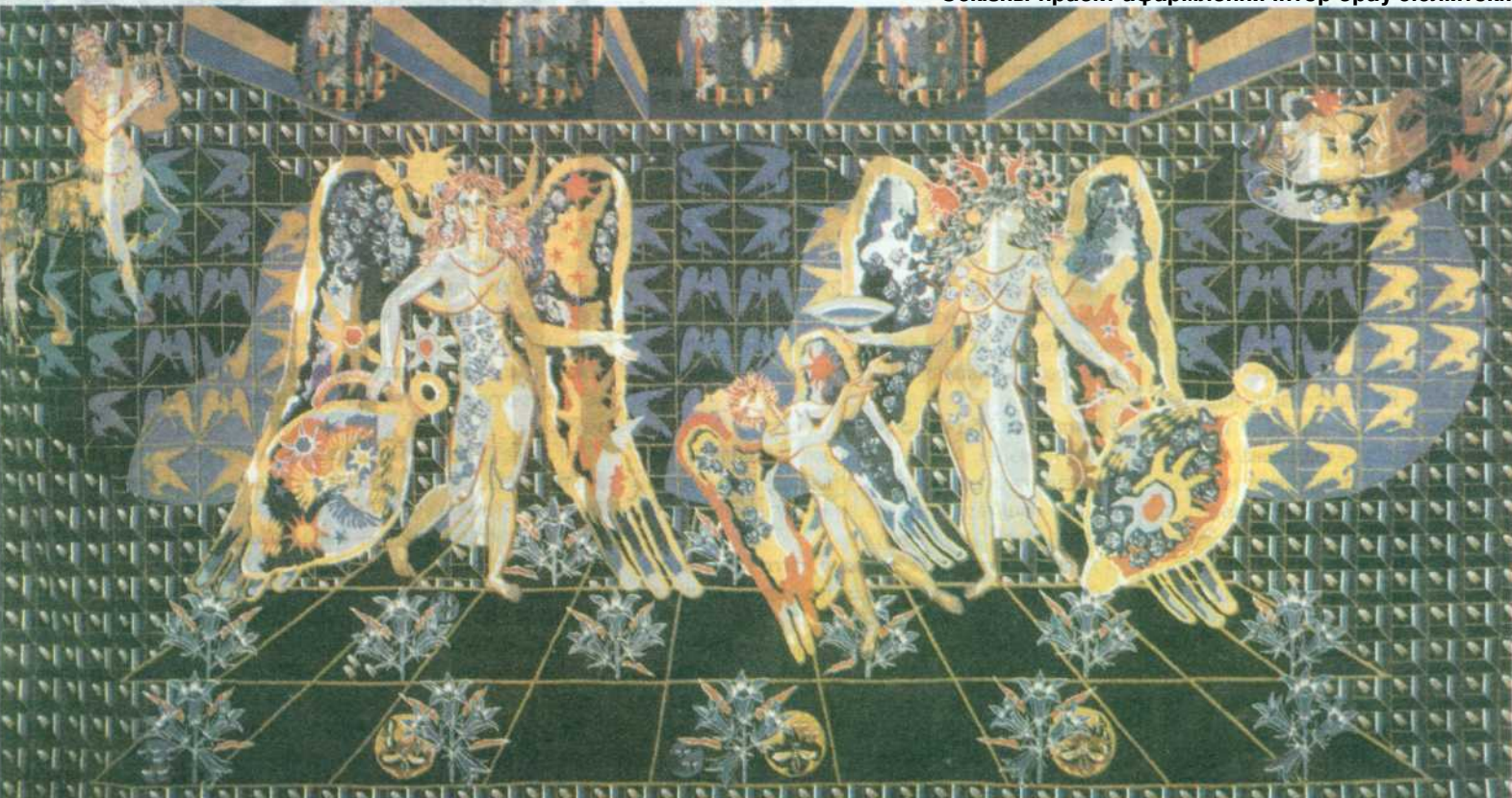
А.Кішчанка. "Зорка Венера". Габелен.