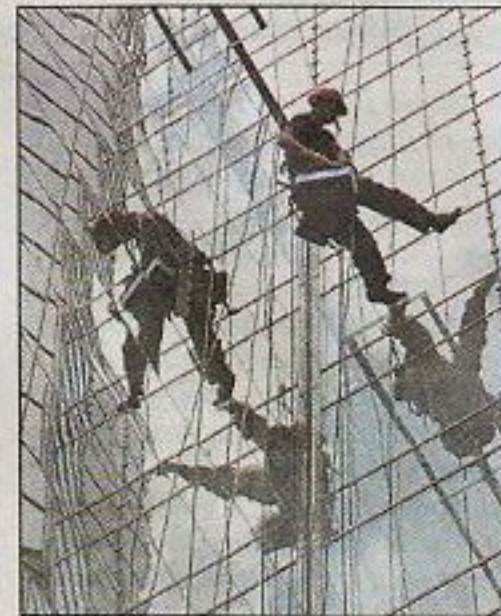
Кристалл библиотеки – это 36 тыс. квадратных метров стекла и стен.

В нашей работе ничего сложного нет, главное – чтобы было к чему подвязаться.