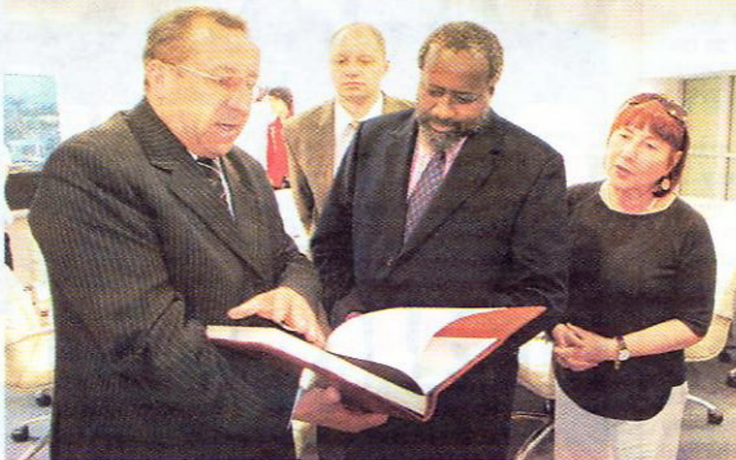
Міністр культуры Рэспублікі Беларусь Уладзімір Матвейчук і міністр мастацтваў і культуры Паўднёва-Афрыканскай Рэспублікі Пало Джордан абменьваюцца сувенірамі.