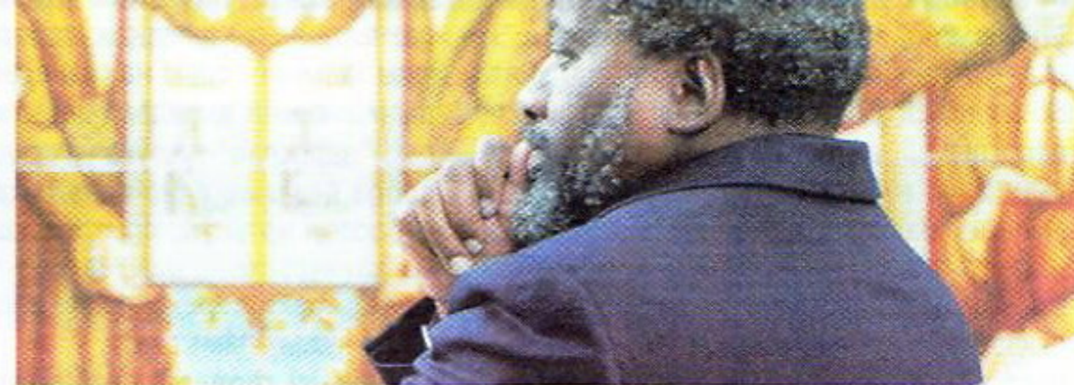
Міністр мастацтваў і культуры Паўднёва-Афрыканскай Рэспублікі разглядае інтэр'еры бібліятэкі.

чыў, што галоўнай задачай для яго міністэрства мастацтваў і культуры ПАР сёння з'яўляецца дэмакратызацыя культуры. "Толькі 14 гадоў прайшло з той пары, калі грамадства нашай краіны было падзелена, — сказаў міністр. — У мінулым гэтая сітуацыя разглядалася трагічным чынам — сёння мы глядзім на гэтую старонку сваёй гісторыі як на блашлавенне. І цяпер наша праблема заключаецца ў тым, каб пашырыць доступ да культурных здабыткаў нашай краіны для ўсіх слаёў насельніцтва, злучыць у адну нацыю "рознакаляровую стужку" народнасцей, што жывуць у ПАР".