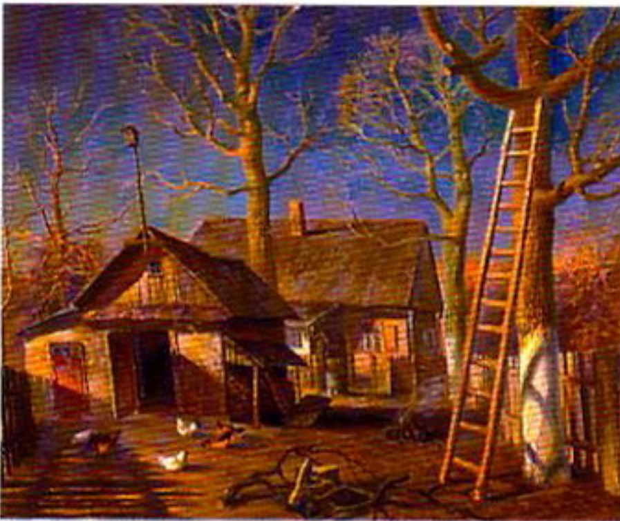
Д.Валынец. Вясна. Алей. 1997. Кіраўнік Л.Раманоўскі.

На выставе ў Музеі сучаснага выяўленчага мастацтва вельмі моцна адчуваўся подых мінулага. Валадарылі класічныя сюжэты і кампазіцыі: маці з малым на руках, змрочны блакадны Ленінград, вясковыя вяселлі, нацюрморты... А яшчэ — паркалёвыя сукенкі, рабочыя мазалі,