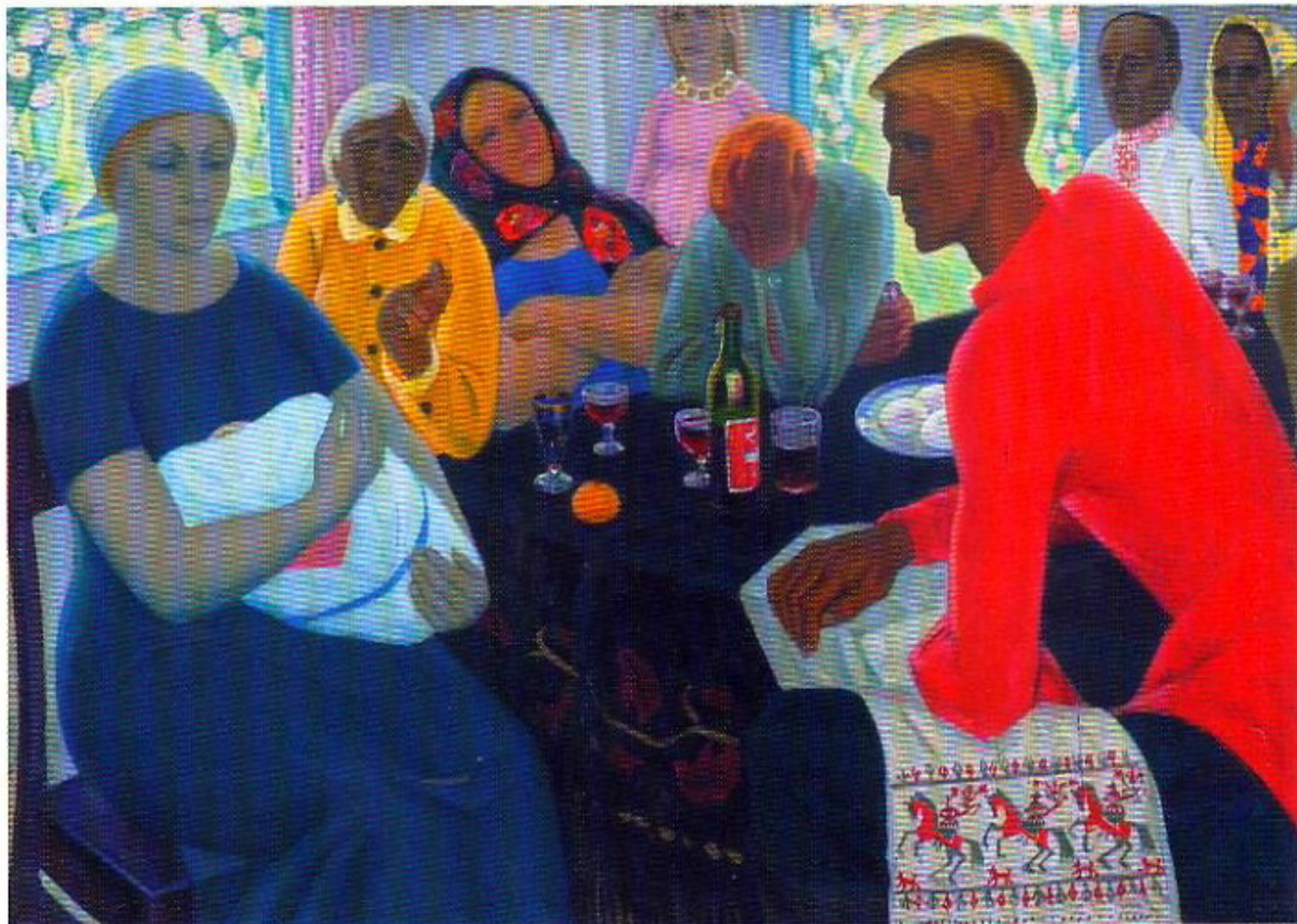
М.Рагалевіч. Сямейнае свята. Алей. 1964. Кіраўнік Л.Шчамялёў.

Безумоўна, моладзь, якая выйшла на вольны свет са сцен навучальных уста-