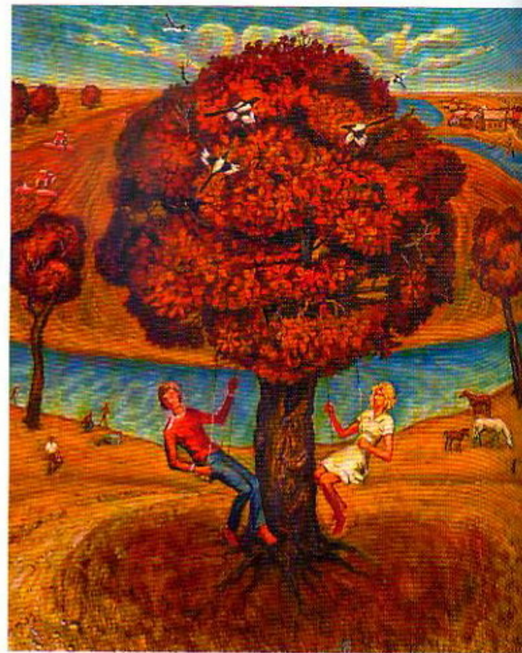
П.Шабуня. Арэлі. Алей. 1979. Кіраўнік А.Малішэўскі.

коні... Назвы простыя, без выкрутасаў — «Сход», «Трактарысты», «У вёсцы», «Вясковыя дзяўчаты», «Лета», «Арэлі», «Будаўнікі». Дзяржава, адлюстраваная на гэтых палотнах, знікла, а творы — жывуць, фарбы не цьмянеюць — ззяюць ціхім святлом у невялікай музейнай зале. Нават іх аўтары — вядомыя сёння майстры — з