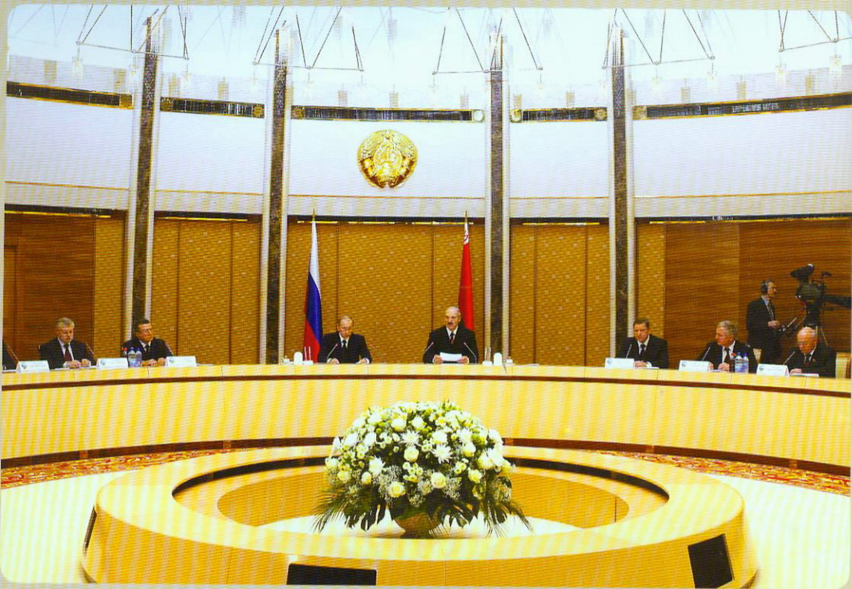
Заседание Высшего Госсовета Союзного государства, которое проходило в здании Национальной библиотеки 14 декабря 2007 г.