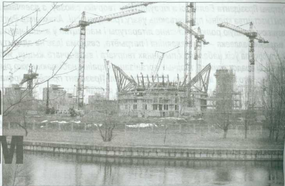
Ідзе будоўля бібліятэкі.

...Мы аглядалі новабудуўлю ў адзін слотны снежаньскі дзень. Складаная канструкцыя, якая заняла ладную частку былой пусткі ля станцыі метро "Усход", пакуль не можа ўраж-