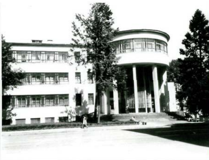
Здание библиотеки (архитектор Г. Лавров).

В 1946 году Чрезвычайной государственной комиссией по установлению и расследованию злодеяний немецко-фашистских захватчиков были зафиксированы общие потери Государственной