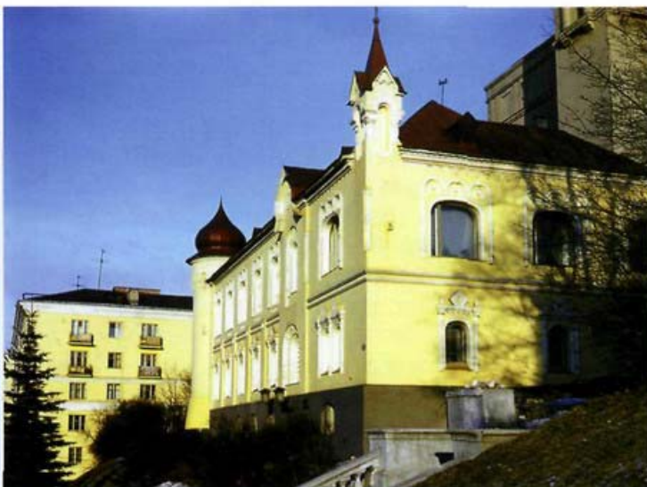
1922 год. ул. Захарьевская, Белорусская библиотека.

Белорусского государственного университета одновременно является Государственной библиотекой Беларуси под общим наименованием «Белорусская государственная и университетская библиотека». За библиотекой были закреплены функции государственного книгохранилища, научно-исследовательского учреждения в области библиотековедения, библиографоведения и книговедения, центра библиографической обработки документов и издания библиографических материалов, ведения сводного каталога библиотек Беларуси, Белорусской книжной палаты.