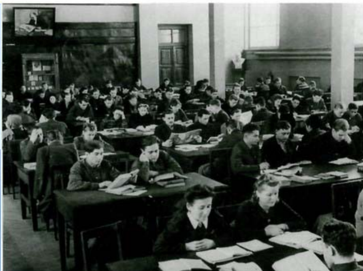
1936 год. В читальном зале.

В послевоенный период Библиотека с успехом выполняла свои функции, главной из которых оставалось формирование универсального фонда документов. В первую очередь это относилось к национальному наследию, документам по истории и культуре Беларуси. Приоритеты в деятельности Государственной библиотеки БССР были определены её статусом центрального государственного книгохранилища БССР, центра межбиблиотечного абонементов, научно-методической и библиографической работы для библиотек республики, а также основной базы библиотечного и библиографического обслуживания, научно-исследовательской работы в республике. В 1972 году указом Президиума Верховного Совета СССР Государственная Библиотека БССР была награждена Орденом Трудового Красного Знамени.