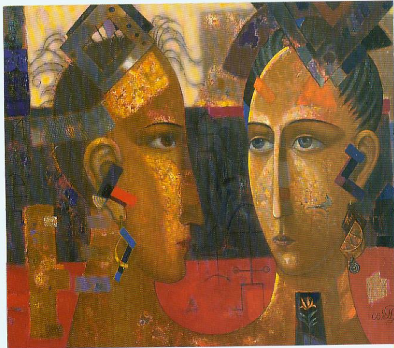
Г. Драздоў. Дзве паненкі. Алей. 2006.

а значыць і само мастацтва змяняюць нашы ўяўленні аб часе. У мастацтва — свой час: не той, які рэгульнае звычайнае жыццё, і нават не той, які адбывае сваю хаду на гадзінніку гісторыі. Па сутнасці, у мастацтве размываюцца межы паміж мінулым, цяперашнім і будучым. Творчая фантазія падобная да вольнай птушкі, а сам мастацкі твор ніколі не замкнёны ў часе. Можна распрацоўваць гістарычную тэма-