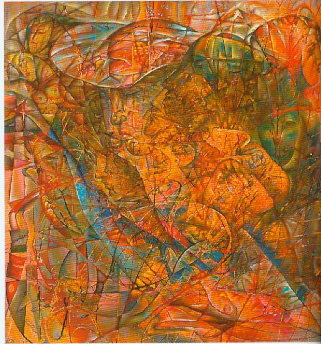
В.Бурдзін (Расія). Твары. Алей. 2005.

Ідэя правядзення выставы з такой назвай нарадзілася даўно. Спачатку меркавалася зрабіць экспазіцыю камернай і не такой прадстаўнічай. Але напрацаваныя тэхналогіі правядзення буйных мастацкіх праектаў дазволілі пашырыць маштаб выставы да міжнароднай. Удзел творцаў з розных краін свету дапамог паказаць шырокую панараму мастакоўскіх поглядаў на сутнасць «чалавека прыгожага»,