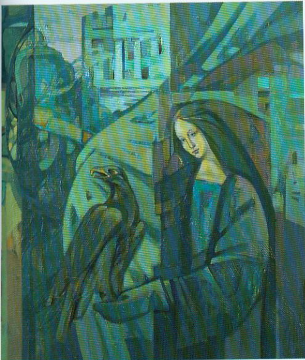
Ф. Ястраб. Дыяна з сокалам. Алей. 2007.

Нясыграныя п'есы для кампазітара, ненадрукаваныя раманы для пісьменніка, закінутыя ў кут майстэрні і нікім не запатрабаваныя карціны для мастака — гэта калі не трагедыя, то сапраўдная драма. Калі творцу не ведаюць, то яго