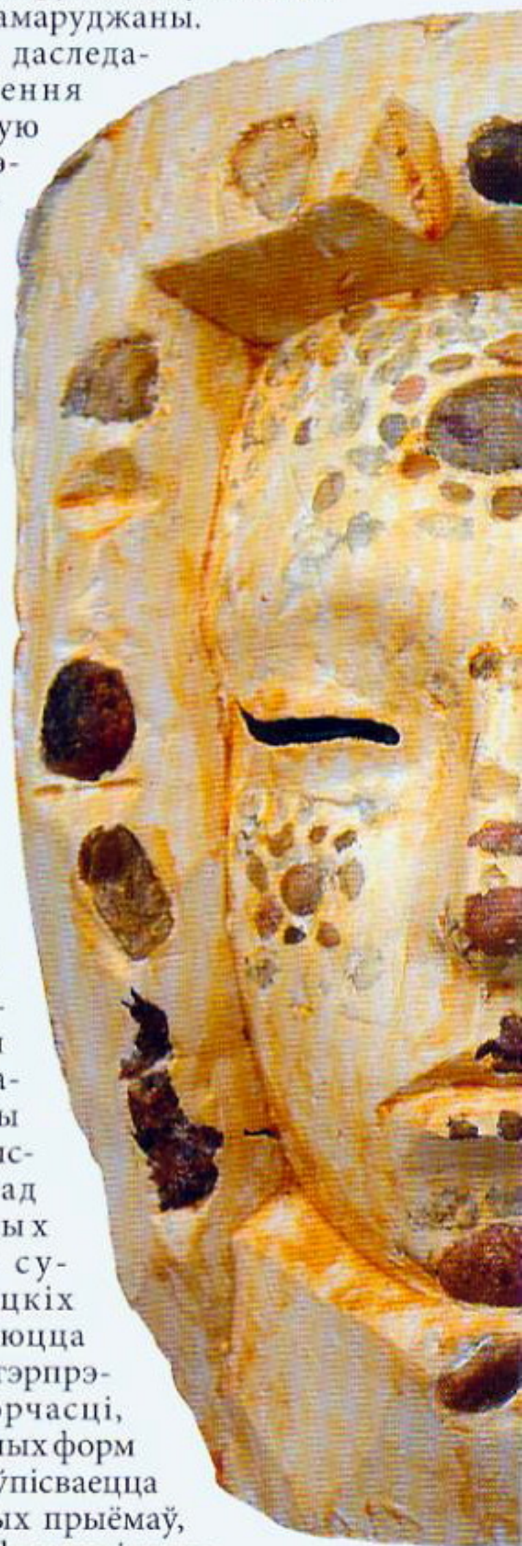
С.Варкін. Маска. Гіпс. 2006.

А сённяшні мастак не столькі адлюстроўвае форму, колькі арганізуе камунікацыі, стварае не падобны, а пазітыўны жэст.