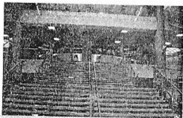
Центральні сходи НБ Білорусі

Метою візиту був обмін досвідом і вивчення інноваційних методів діяльності бібліотек у сучасних умовах.