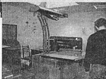
Сканер для сканування газет

Бібліотека розпочала формування електронного архіву національної періодики, причому доступ до електронної версії газет можливий ще до появи