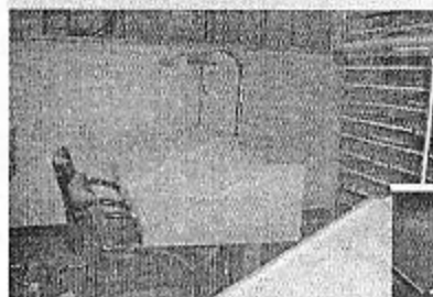
Робочі столи газетного залу

масової, галерейно-виставкової, музейної та екскурсійної діяльності, зв'язків із громадськістю із секторами міжнародних зв'язків, соціально-культурних проєктів, реклами. Протягом 2006