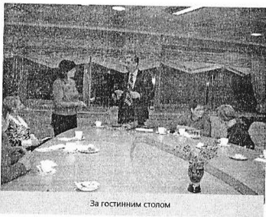
За гостинним столом