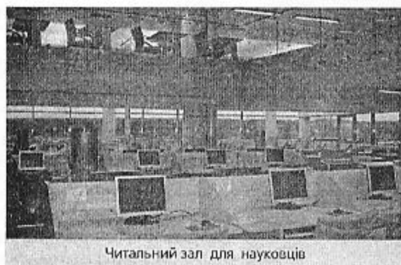
Читальний зал для науковців

року структуру бібліотеки змінювали шість разів.