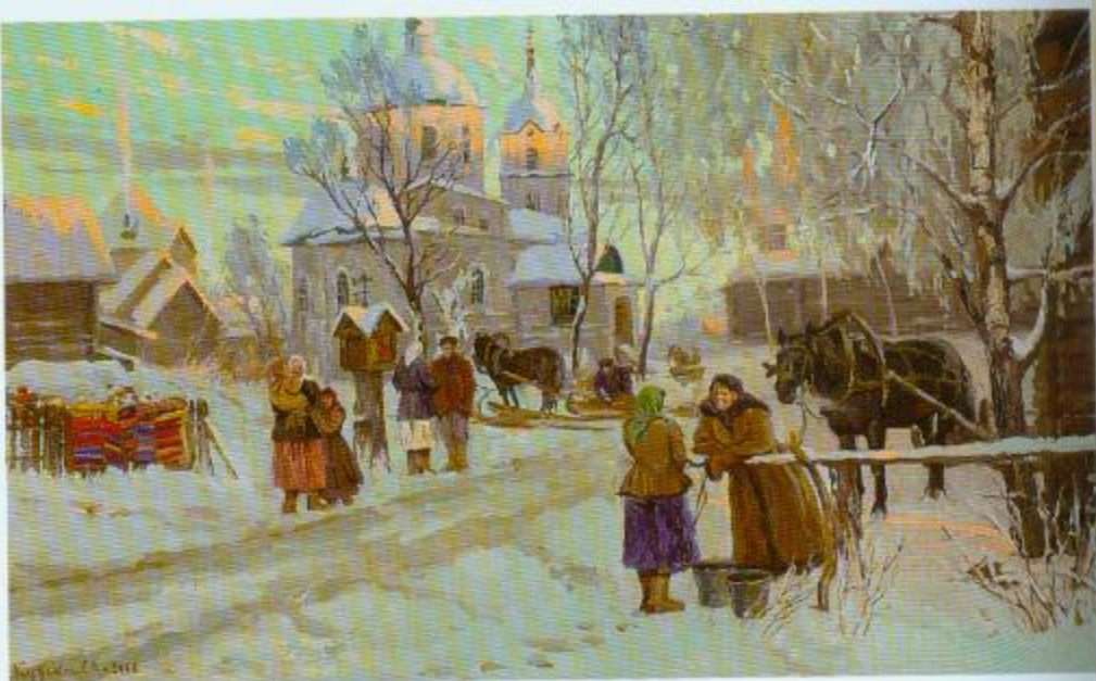
С.Кузькін. Зіма ў Трубчэўску. Алей. 2005.

Пейзажы, напісаныя майстрам, вызначаюцца адметнай, вольнай і магутнай