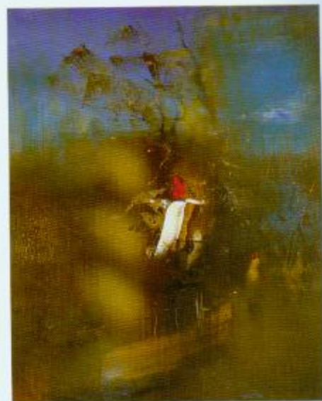
С.Давідовіч. Апошнія яблыкі. Алей. 2006.

Многім творцам, чые работы былі прадстаўлены на выставе, зрабіць пластычную мову жывапісу больш вострай і выразнай дазволіла глыбокае вывучэнне нацыянальных традыцый, іх удумлівае, творчае пераасэнсаванне. Нягледзячы на сваю дэмакратычнасць, даступнасць пейзажны жанр можа ўзнімацца да глыбокай сімвалічна-філасофскай карціны з развагамі пра жыццё чалавека. Ён дае