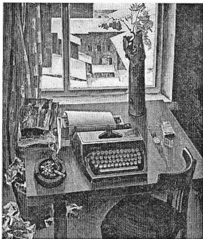
М.В. Данцыг. Нацюрморт (Аб Вялікай Айчыннай...). 1968. П., а. 206×180

жытны і малады» і інш. Многія мастакі прызнаюцца, што пасля Данцыга сказаць што-небудзь новае пра Мінск на мове жывапісу вельмі цяжка. Яго карціны сталі сапраўднай візітнай карткай беларускай сталіцы (гл. уклеіку).