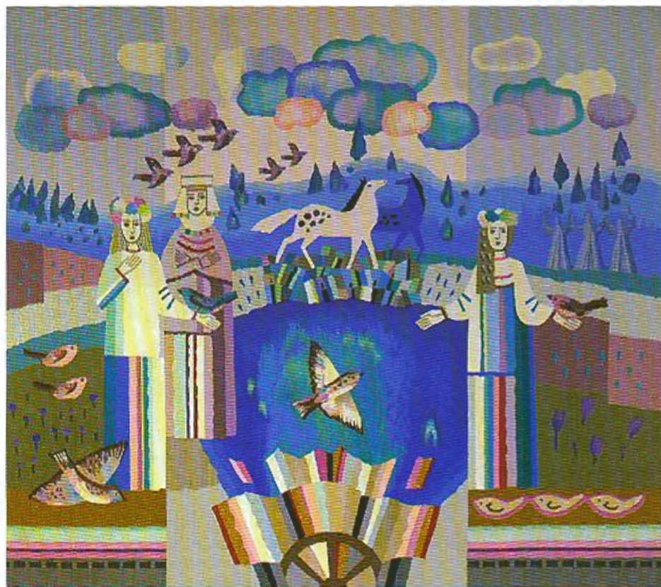
Л.Густава. Гуканне вясны. Класічнае шпалернае ткацтва. 2006.

У нас, безумоўна, былі іншыя прычыны адбору, чым пры афармленні творами жыванісу, манументальным мастацтвам. Але графіка — неад'емная частка бібліятэкі. Нават назва яе паходзіць ад слова «граф» — пішу, ад самага свайго пачатку графіка была звязана з кнігай. І таму незразумела, як магло ад-