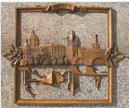
Прага. Рэльеф на пастаменце помніка Ф.Скарыну. Бронза. 2006.

Галоўнае ў кожным творы мастацтва, асабліва ў скульптурным, — бездакорнае валоданне яго пластычнай мовай. А.Дранец гэтым талентам не абдзелены. Ён вельмі дакладна і ўмела захоўвае ўласную ідэнтычнасць у культурнай прасторы. Лаканічнасць вобразнай сістэмы яго работ ідзе ад традыцыйнай манеры народных майстроў мінулых стагоддзяў. У помніку Ф.Скарыну скульптар, як і яго папярэднікі, імкнуўся ўзмацніць экспрэсіўнасць вобраза, ён