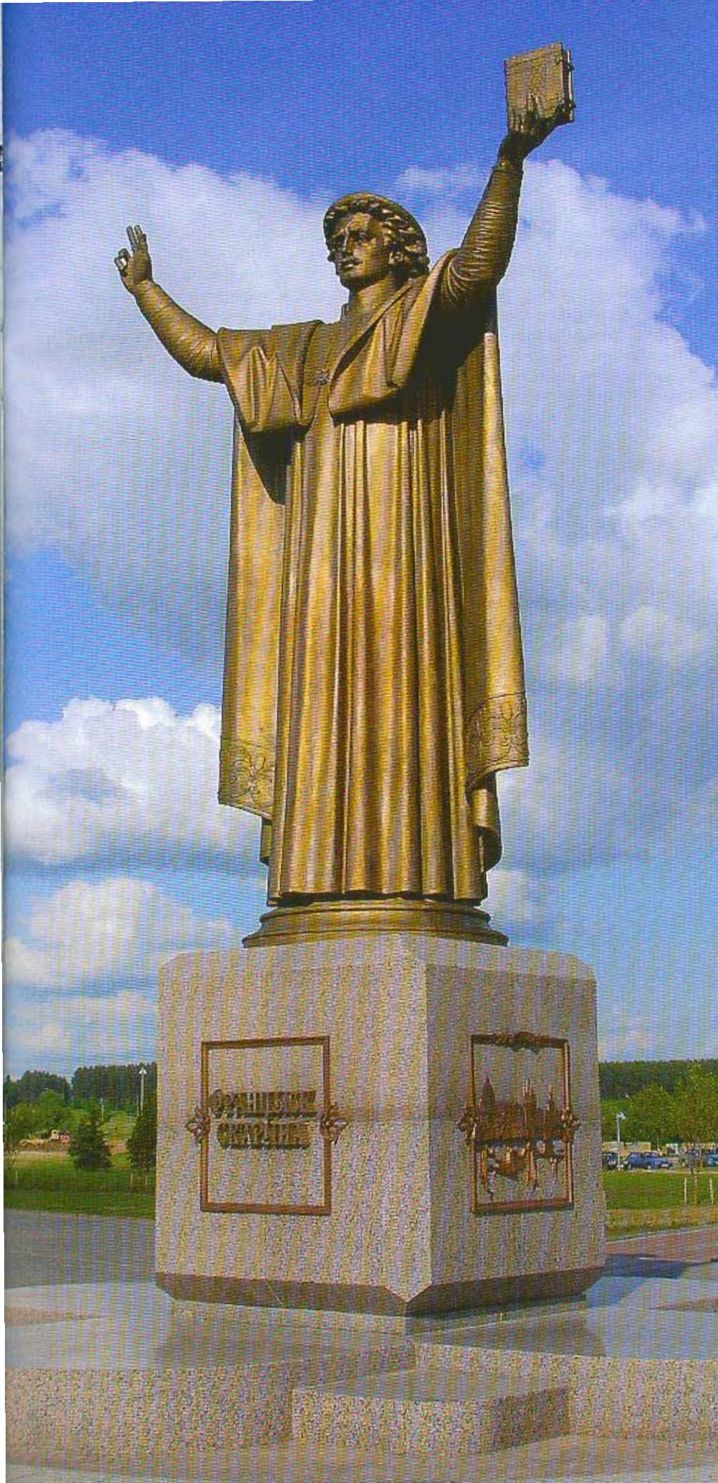
Помнік Франціску Скарыну. Бронза, граніт. 2001–2006.

звярнуўся да абагульнення форм з мінімальным адхіленнем ад лаканічнасці пры дакладнай прапрацоўцы дэталяў. А.Дранец умее слухаць свае ўнутраныя імпульсы, ён вольны ў пластычным рапэнтні работы. Пры гэтым ніколі не забывае пра канструкцыю, «стрыжаны», на якім трымаецца манументальная фігура. Заканамерна, што скульптар падкрэсліў у вобразе свайго героя, асабліва ў партрэтнай частцы, моц розуму, духоўную ўпэўненасць асветніка. Вобраз Франціска Скарыны трактуецца ім у рэчывычы новай сімвалічнай ідэі, згодна з агульнаграмадскімі зменамі светаадчування, падпарадкоўваецца рэзка ўзрослай дынамічнасці жыцця, адкрытасці і ўзмацненню рытмаў у павакольным свеце. Мастак здолеў адчуць змены ў часе і з дастойным свайго героя майстэрствам увякашомніць вобраз вялікага сына беларускага народа.