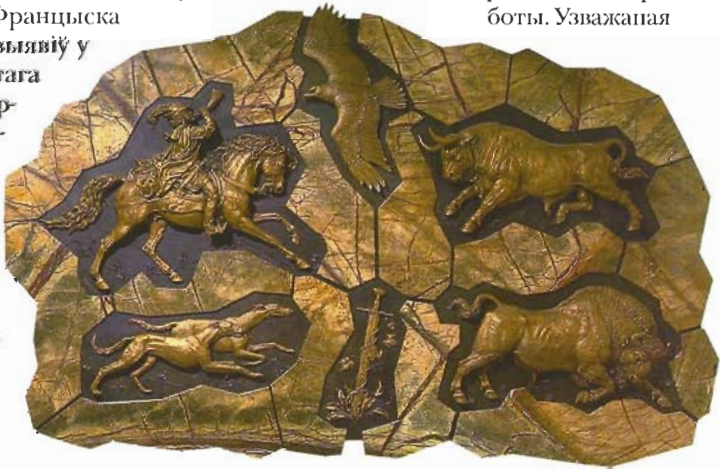
С.Бандарэнка. Песня пра зубра. Бронза, камень. 2006.

вочы ўяўнай лёгкасцю дэкаратыўнай пабудовы кампазіцыі. Уражанне падтрымліваюць шматлікія атрыбуты Сярэднявечча. Пэўная казачнасць, скамароства ўдала скарыстаны мастакамі для таго, каб зацікавіць гледача, прыцягнуць яго ўвагу. Захаваўшы эффект своеасаблівай «кірмашовасці» — мяккі гумар цэнтральнай кампазіцыі, рэльефы рантоўна цалкам інакш раскрываюцца перад гледачом сур'езнасцю тэм і іх вырашэння ў левай і правай частках работы. Узважаючая