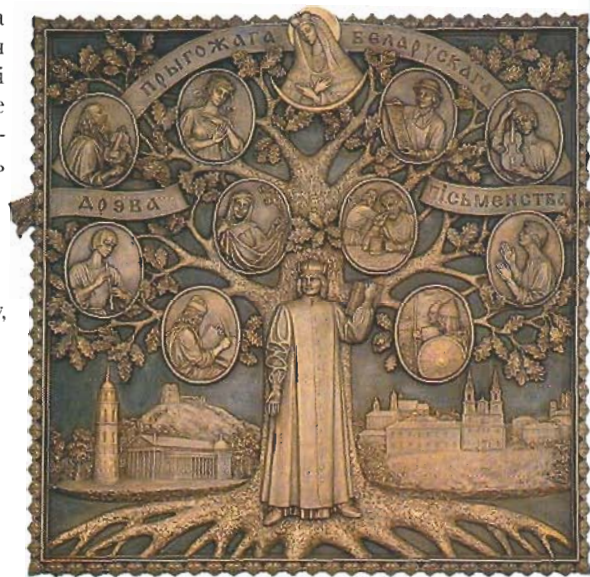
П. Лук. Дрэва прыгожага беларускага пісьменства. Бронза. 2006.

Ярка выяўленая архітэктоніка саступіла месца камернаму рашэнню (не зважаючы на манументальныя памеры) твора ў скульптурным рэльефе