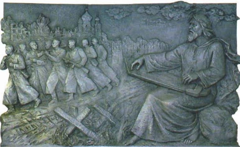
А.Заспіцкі. Гусляр. Сілунін. 2006.

Але галоўнае мастакі здолелі перадаць: гэта адмова ад павучальнасці на карысць эмацыянальнасці, зварот не да калектывнай памяці былых пакаленняў, а да вобразнага мыслення індывідуальнага глядача, выдатнае валоданне рознымі тэхнічнымі прыёмамі, удалае выкарыстанне цытат і алегорый у трактоўцы тэм, стрыманая натуралістычнасць на фоне стылізацыі. Скульптары не проста занатоўваюць выяву, яны тлумачаць яе, фіксуюць сутнасць жыцця мінулага і сучаснага, абавіраючыся на акадэмічную традыцыю. У работах спалучаюцца прафесійныя напрацоўкі і чуйнасць творчай інтуіцыі, і гэта адпавядае складанасці сучаснага кантэксту, багаццю яго сэнсавых адценняў і варыянтаў прачытання.