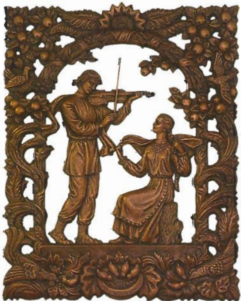
А.Батвінён, А.Чыгрын. Сымон-музыка. Бронза. 2006.

Дарэчы, сцэна палявання сустракаецца ў рэльефах Нацыянальнай бібліятэкі неаднаразова. Сяргей Бандарэнка, шукаючы адпаведнае адлюстраванне знакамітага твора М.Гусоўскага «Песня пра зубра», звярнуўся да апісанняў і расповедаў пра паляванне. Размясціць на сцяне рэльеф вагою ў 600 кілаграмаў можна было, толькі абраўшы для рабо-