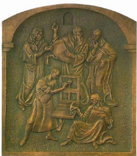
Л.Гумілеўскі, С.Гумілеўскі. Сказ аб Нясвіжы. Трыпціх. Бронза. 2006.

станоўчым эмацыянальным настроі, мяккай стылізацыі форм, абагульненым псіхалагізме і анапядальнасці — на чым, насамрэч, і грунтуецца сучасная беларуская акадэмічная сістэма прафесійнага мастацкага навучання. Яе асаблівасці палягаюць у прыярытэце прафесійных павыкаў над гуманітарнымі ведамі, дамінаванні лепкі над разьбой і высяканнем, перавазе інтэр'ернай пластыкі, анапядальнасці над «чыстай» выяўленчасцю.