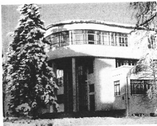
Главный корпус Национальной библиотеки Беларуси (1932—2005).

Важным этапом в развитии международного сотрудничества в сфере библиотечного дела в республике явилось вступление Бел. библиотечной ассоциации и Нац. библиотеки Беларуси в Международную федерацию библиотечных ассоциаций и учреждений (IFLA). Налажено также сотрудничество с Департаментом документации, библиотек и архивов ЮНЕСКО. Республиканские научные библиотеки участвуют в деятельности профессиональных международных организаций (напр., Бел. с.-х. библиотека состоит членом 10 международных организаций и ассоциаций). Важным направлением международного сотрудничества являются приобрете-