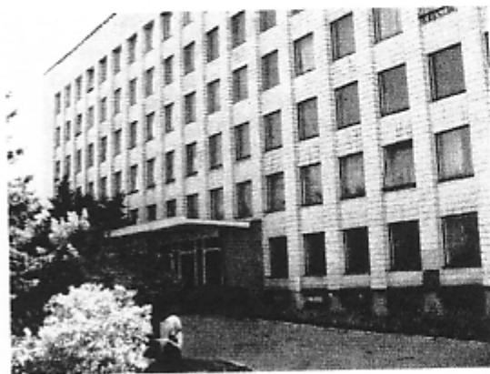
Центральная научная библиотека имени Я.Коласа Национальной академии наук Беларуси.

ние и обмен информационными ресурсами. Наиболее распространённые формы приобретения информационных ресурсов — покупка и дарение источников информации. Успешно осуществляется пополнение информационных ресурсов библиотек за счёт добровольных пожертвований и даров международных и зарубежных фондов и организаций. Самые широкие книгообменные связи в республике осуществляет Центральная научная библиотека Нац. АН Беларуси, которая ведёт книгообмен с 776 организациями из 56 стран, Нац. библиотека Беларуси — с 331 организацией из 53 стран. Бел. библиотеки участвуют в сфере модернизации материально-технической базы и программного обеспечения, в реализации международных проектов (открытие Американского информационного центра, библиотеки Немецкого культурного центра имени Гёте, Франко-бел. зала в Минской областной библиотеке имени А.С.Пушкина, осуществление бел.-немецко-французского проекта «Медиаавтобус», бел.-российского проекта «Сокровища славянской культуры» и др.), в работе международных конференций и семинаров, проведении в республике международных встреч, конфе-