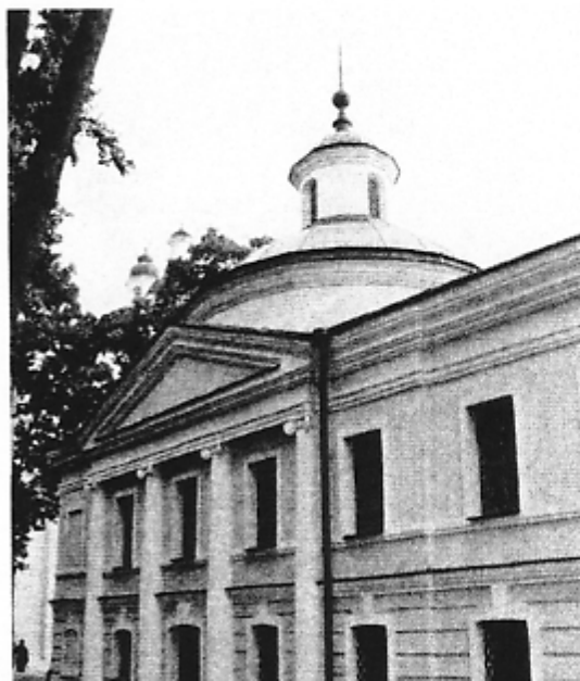
Музей-библиотека Симеона Полоцкого в Полоцке.

ции Республики Беларусь, нормативных документов по стандартизации и пром. каталогов; осуществляет методическое руководство сетью научно-технических библиотек (около 300), патентными службами и службами стандартизации по работе с фондами научно-технических документов. Бел. с.-х. библиотека является нац. информационным центром по проблемам сельского и лесного хозяйства, продовольствия, пищевой промышленности, природных ресурсов и имеет самую крупную в Беларуси коллекцию документов по сельскому хозяйству (500 тыс. экз.). Библиотека