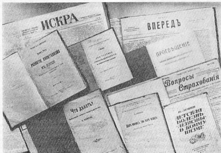
Першыя выданні ленінскіх прац і комплекты ленінскіх газет, якія захоўваюцца ў бібліятэцы.