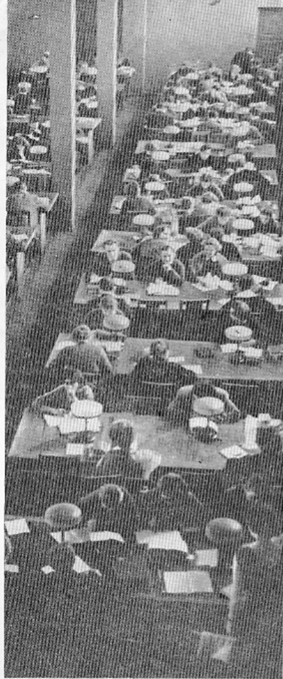
У агульнай чытальні бібліятэкі.

ханьня намі на працягу паўгадзіны, хутка былі дадзены адказы: чытайце ў такой кнізе, у такім часопісе, у такім артыкуле і нават на такой вась старонцы.