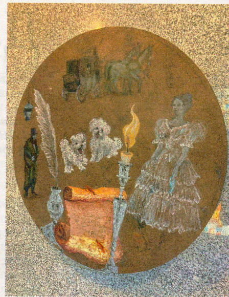
Ала Кушнер «Заметки на полях», 2024 г.

грунт, на які абапіраўся творца. Усевалад Свентахоўскі шмат эксперыментываў, але не адмаўляўся ад традыцыі, быў здольны паяднаць мінулае і сучаснасць.