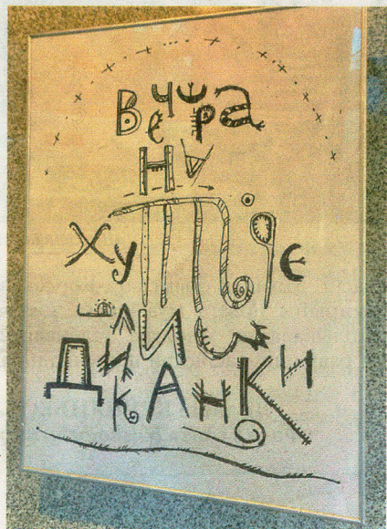
Усевалад Свентахоўскі «Вечары на хутары каля Дзіканькі», 2023 г.