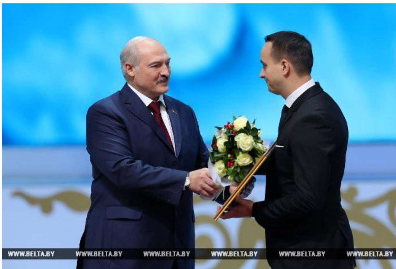
Специальной премии удостоен авторский коллектив Белорусской государственной академии искусств. Александр Лукашенко вручает награду Константину Костюченко