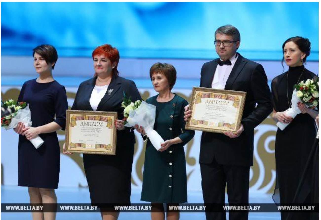
Лауреаты специальной премии