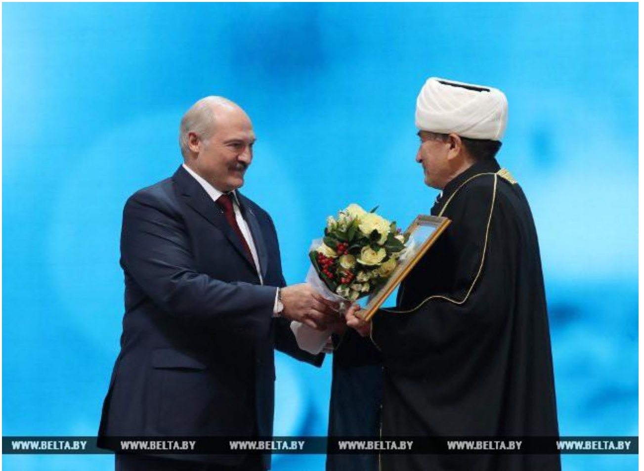
Александр Лукашенко и муфтий Мусульманского религиозного объединения в Республике Беларусь Абу-Бекир Шабанович