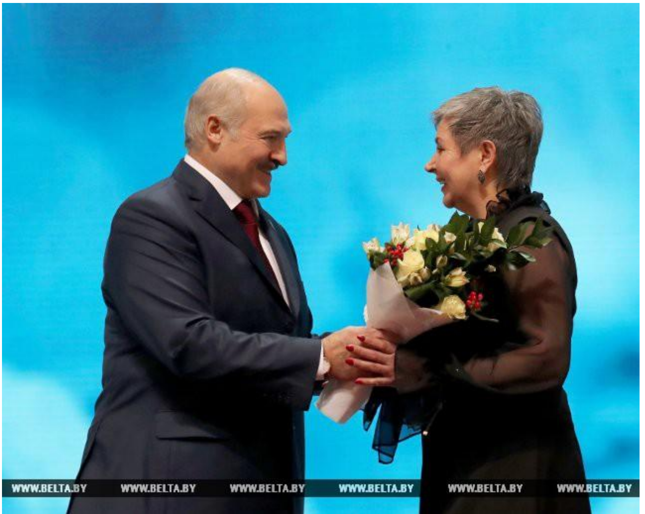
Среди лауреатов премии "За духовное возрождение" - ОО "Белорусский союз женщин"