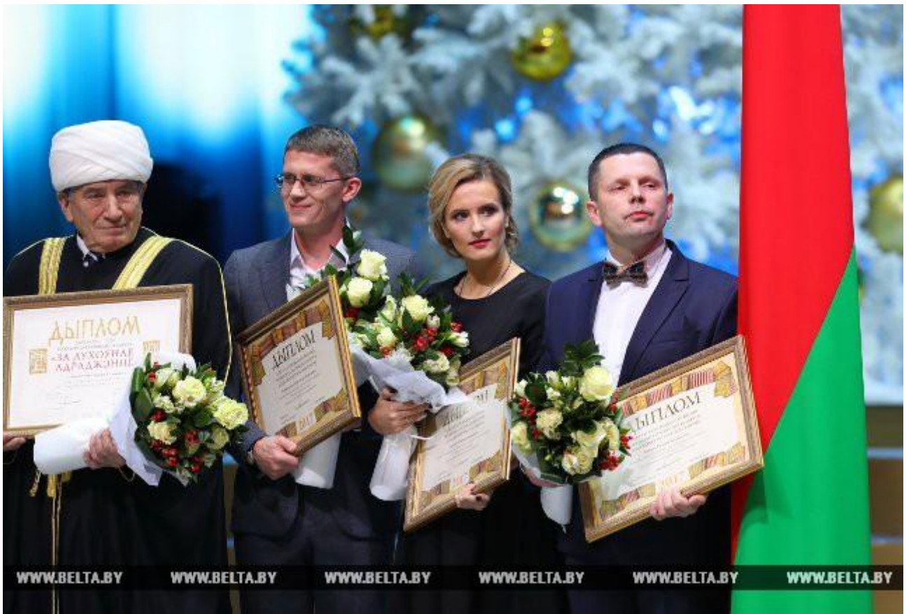
Во время церемонии