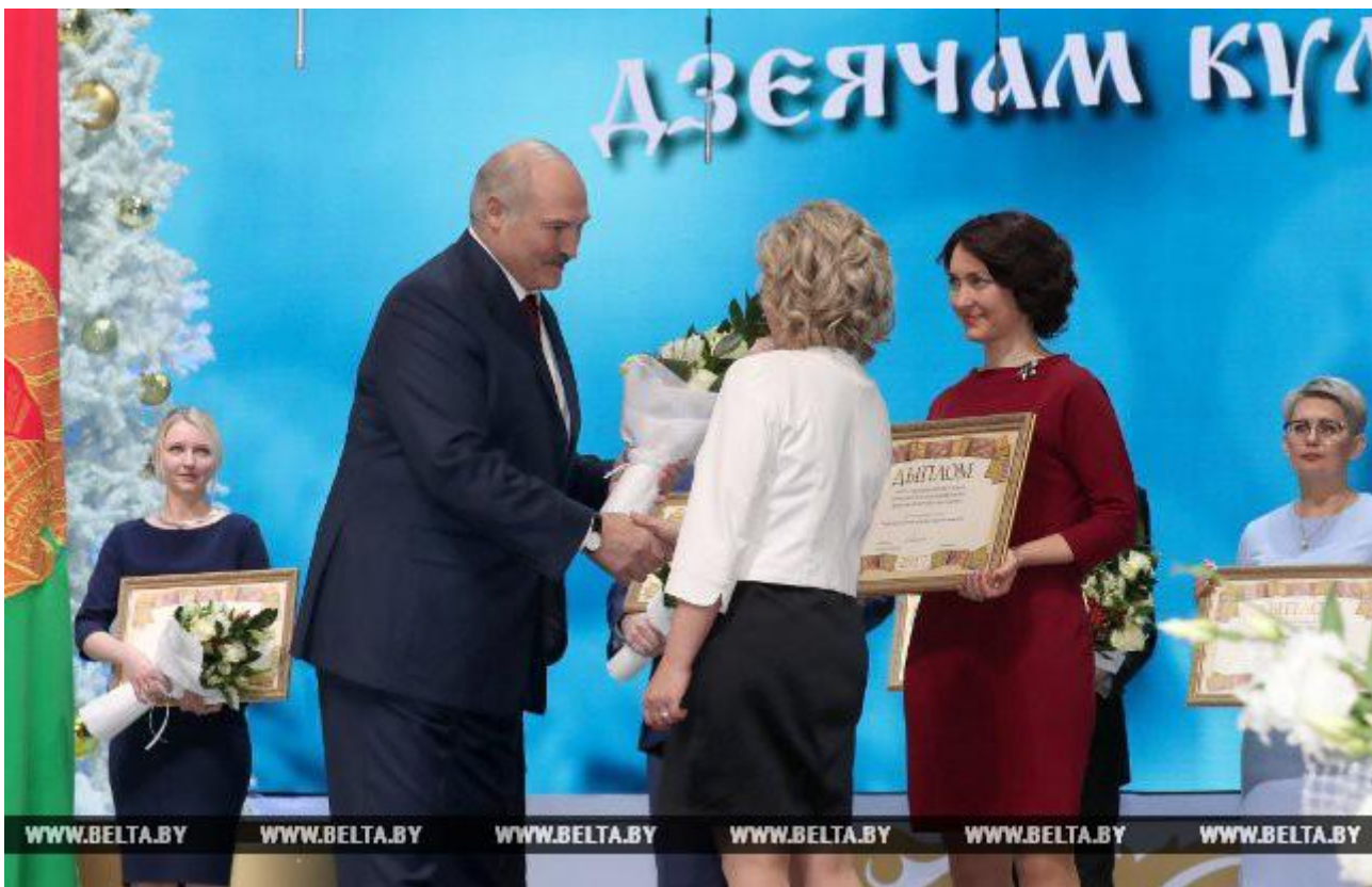
Спецпремии Президента удостоен коллектив Лидского районного центра культуры и народного творчества