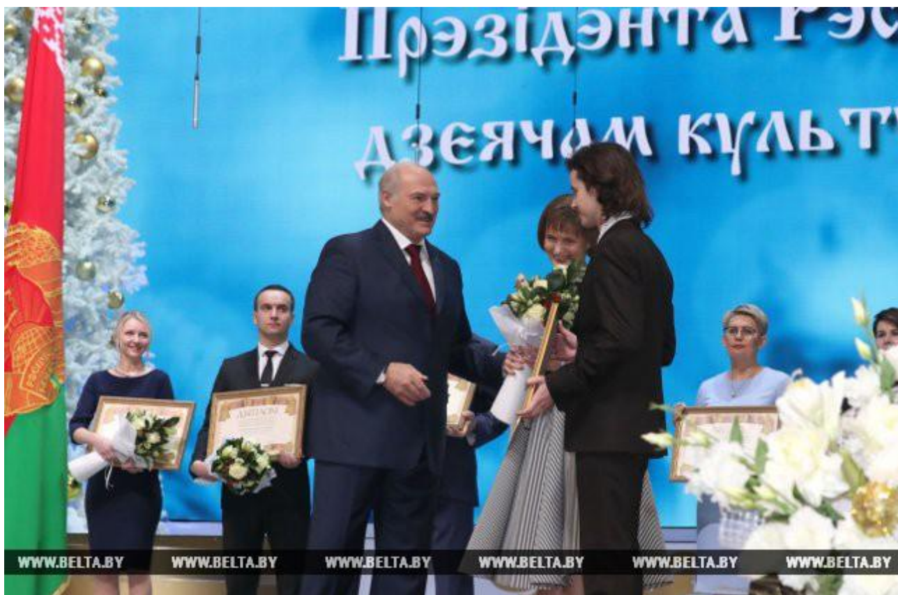
Коллектив Белорусской государственной академии музыки отмечен спецпремией