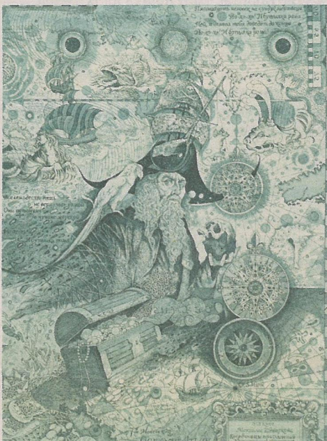
Уладзіслаў Квартальны «Каардынаты прыгод», 2014 г.

Выстаўка «Калекцыя графікі» працуе ў галерэі «Лабірынт» Нацыянальнай бібліятэкі Беларусі. Па словах арганізатараў, экспазіцыя дае панараму сучаснага беларускага мастацтва, аб'яднанага высокім узроўнем прафесійнага майстэрства аўтараў. Прадстаўленыя творы адлюстроўваюць актуальны зрэз сучасных графічных прыёмаў, жанраў, тэм і аўтарскіх вынаходак, падкрэсліваюць значную ролю фарміравання калекцый графікі ў беларускай культуры і развіцці выяўленчага мастацтва. Ubачыць праект можна да 17 верасня.