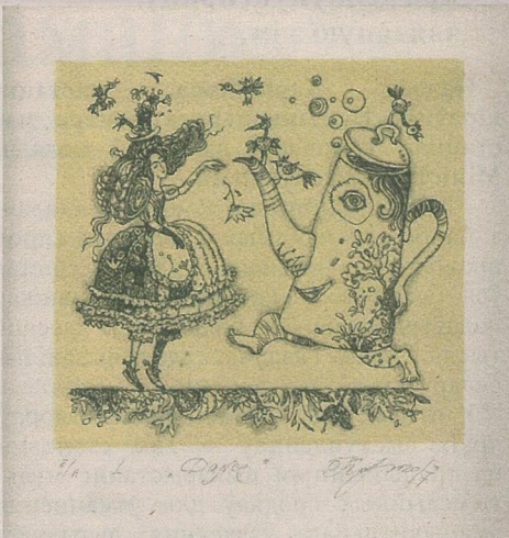
Вольга Крупянкова «Танец», 2016 г.