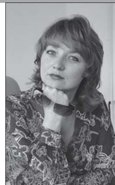
Заведующий отделом Национальной библиотеки Беларуси