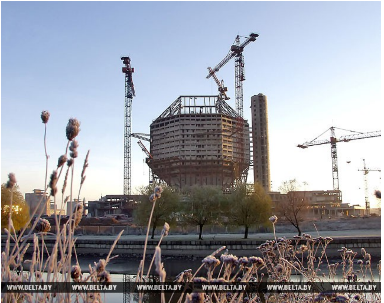
На строительстве здания Национальной библиотеки. 2004 год