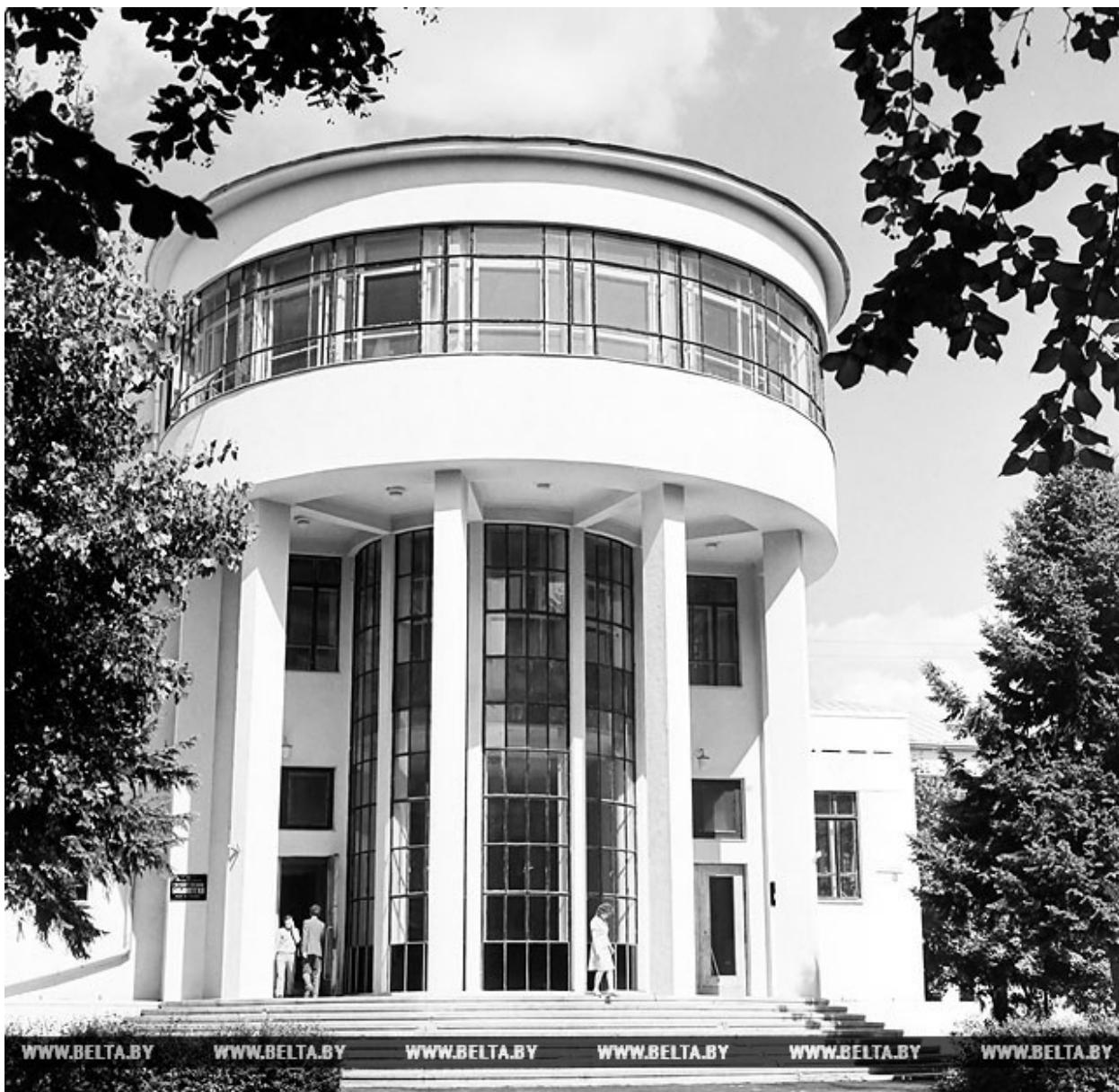
Государственная библиотека БССР им. В.И.Ленина. 1972 год

В 1992 году, уже в суверенном государстве, она получила новое название - Национальная библиотека Беларуси. С течением времени фонды значительно увеличились, поэтому возникла необходимость строительства более масштабного и современного здания. В марте 2002 года Президент Беларуси Александр Лукашенко подписал указ "О строительстве здания государственного учреждения "Национальная библиотека Беларуси".