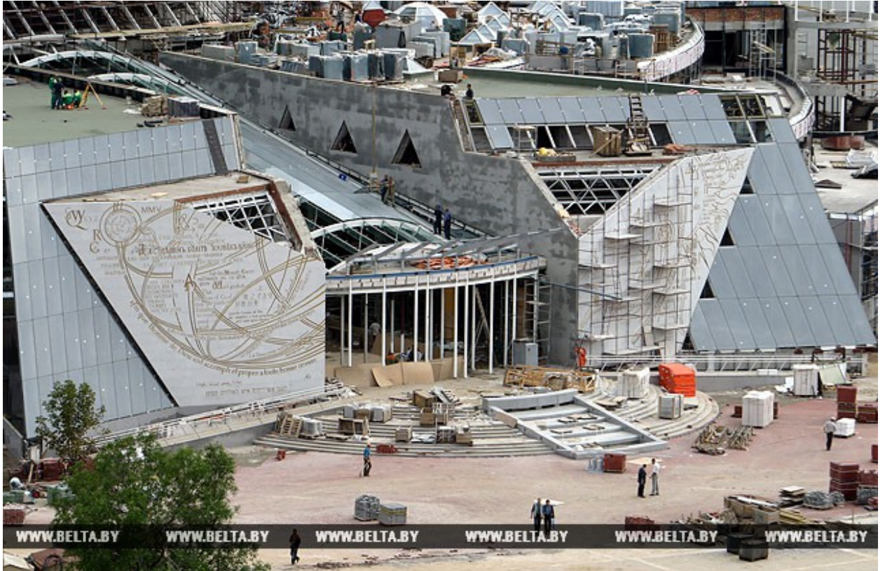
В завершающую стадию вступило строительство Национальной библиотеки. 2005 год