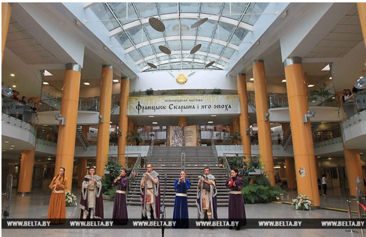
На открытии международной выставки "Франциск Скорина и его эпоха" в Национальной библиотеке Беларуси. 2017 год