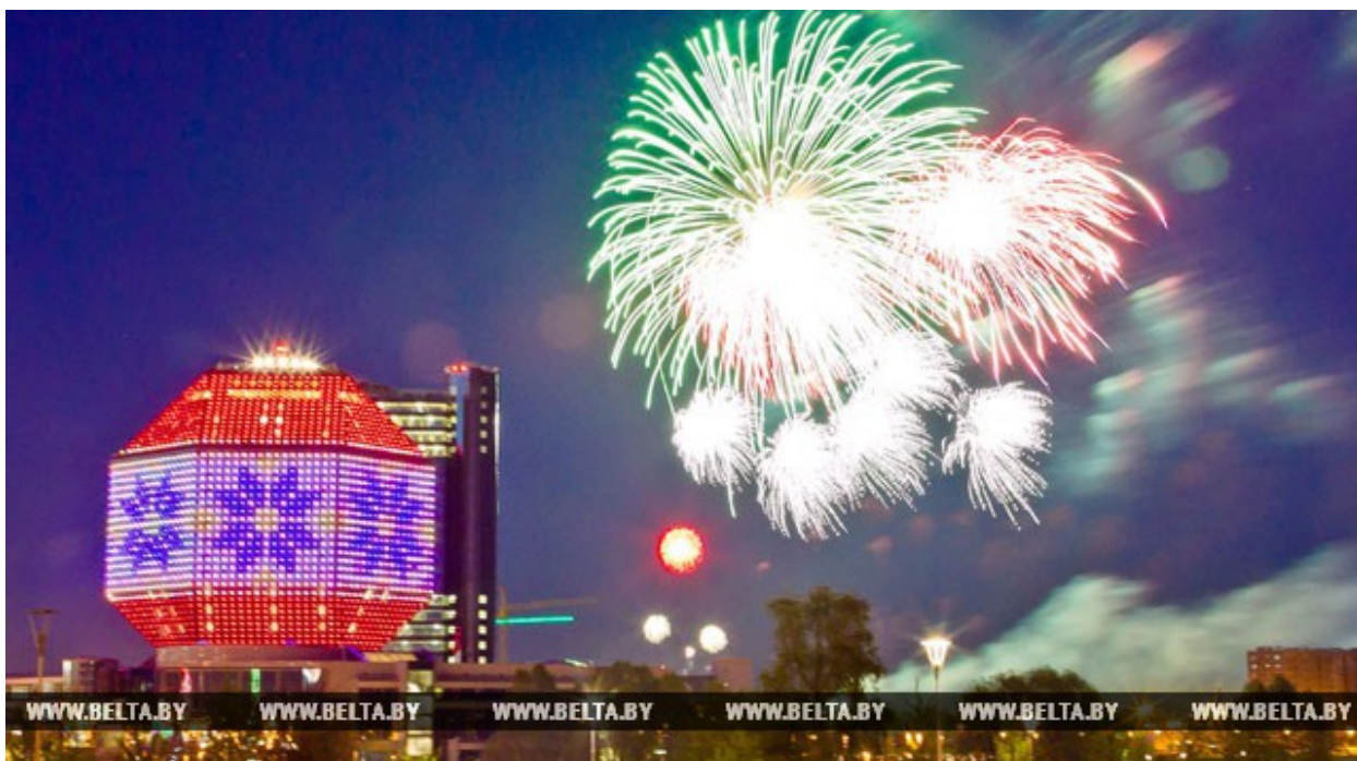
Салют у Национальнай бібліятэцы Беларусі. 2011 год

15 сентября в Беларуси отмечается День библиотек. В республике сегодня действует более 2,6 тыс. библиотек с общим фондом 56 млн экземпляров. Возглавляет систему библиотек страны Национальная библиотека Беларуси. Она была основана в 1922 году при Белорусском государственном университете. В ноябре 1922-го ректор БГУ В.И.Пичета докладывал на 4-м съезде Советов: "Наша университетская библиотека превратилась в государственную, разрастаясь и превращаясь в культурный центр" .