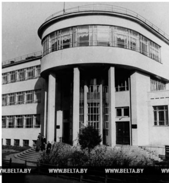
Здание библиотеки им.Ленина в Минске. 1963 год

В 1930-е годы БССР стала первой советской республикой, в которой был введен многоуровневый порядок пересылки заказов по абонементу - от сельской до республиканской библиотеки. Так описывал библиотечные будни корреспондент БЕЛТА: