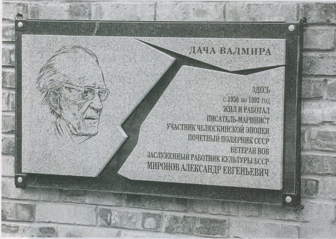
Мемарыяльная дошка на лецішчы А. Я. Міронава ў Кактэбелі.

сваіх паглядзець на гэты суд, а тыя без усялякіх эмоцый яму адказалі: «Ну вядуць, і хай вядуць». І толькі мо з пятнаццатага разу зразумелі, што гэта праўда, але ўбачылі самы канец гэтага шэсця. Так звыкліся з розыгрышамі, што і ў такую рэдкую з'яву паверылі не адразу.