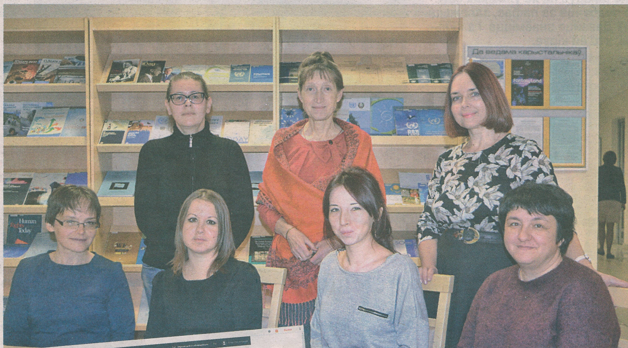
Супрацоўнікі аддзела суправаджэння інтэрнэт-партала Нацыянальнай бібліятэкі Беларусі.