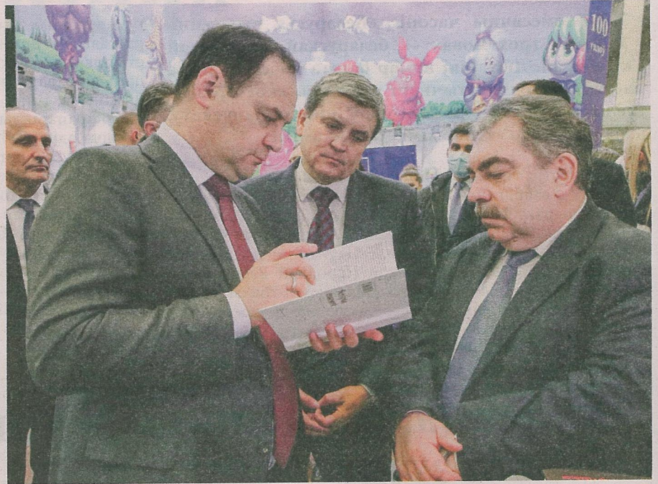
Прэм'ер-міністр Беларусі Раман Галоўчанка, міністр інфармацыі Ігар Луцкі і дырэктар выдавецтва «Мастацкая літаратура» Аляксей Бадак.

Новы фармат гэтага года — літаратурны стартап LitUP, распачаты Міністэрствам інфармацыі і Саюзам пісьменнікаў Беларусі, накіраваны на пошук новых цікавых праектаў, кніг і серый.