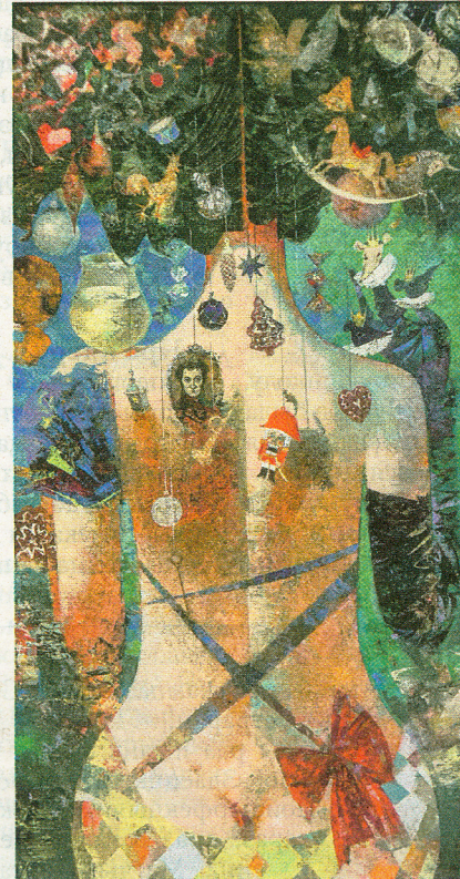
Алена Шлегель «Ёлка. Гофман. Шчаўкунок», 2019 г.

Многія карціны на выстаўцы «Зімовая» адлюстроўваюць першы снег — вобраз, які дорыць надзею на новае і лепшае. Снег на вачах хавае тое, што надакучыла, пазбаўляе вострых вуглоў, тоіць у дальняй шафцы ўсё недарэчнае, крыўднае і несправядлівае. Так, ён дапамагае настроіцца на іншы лад, толькі вярта не забываць (і беларускія зімы пра гэта ўпарта нагадваюць): калі снег кладзецца на гарады і вёскі, на бляклыя рэшткі зелены і тонкі лёд азёр, ён нядоўга застаецца такім жа ідэальным, як на карціне.