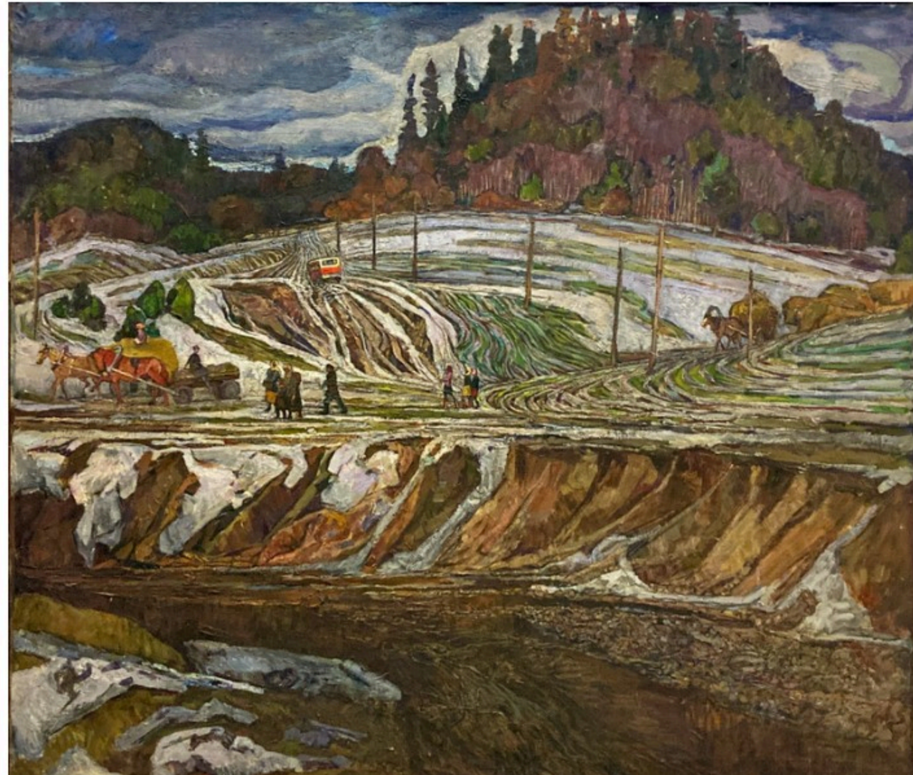
Сяргей Каткоў «Лагойскі мытыў», 1968 г.

Нацыянальная бібліятэка, Нацыянальны архіў і Беларускі саюз мастакоў арганізавалі выставачны праект «Назаўжды разам» і прымеркавалі яго да 85-годдзя ўз'яднання Заходняй Беларусі і БССР і Дня народнага адзінства. Экспазіцыя, з якой можна пазнаёміцца ў выставачным комплексе галоўнай бібліятэкі краіны, з розных бакоў раскрывае тэму дзяржаўнага свята.