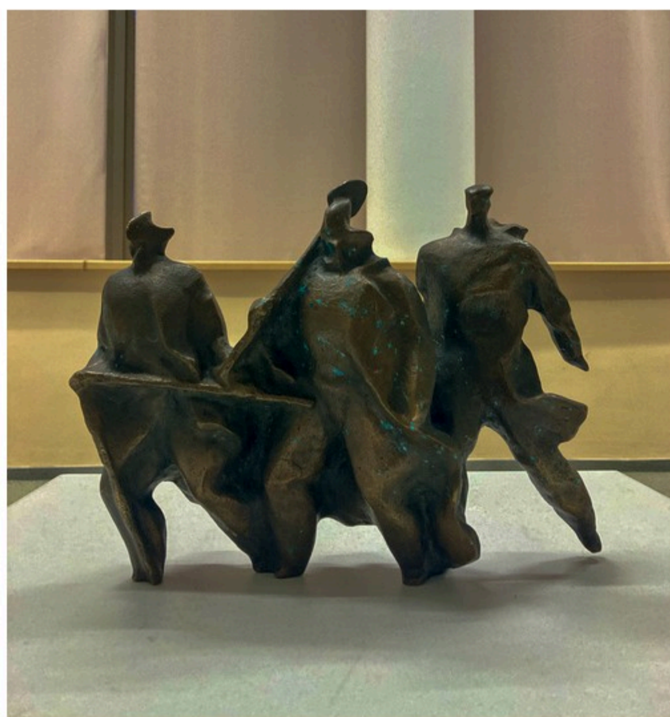
Васіль Дубовік «Зямлю — сялянам», 1989 г.