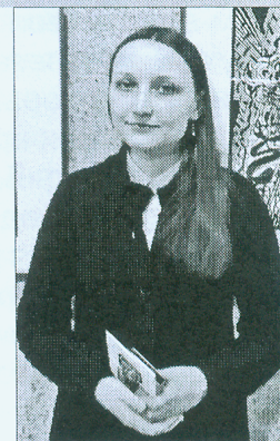
Галоўны бібліёграф Нацыянальнай бібліятэкі Беларусі

Адным з напрамкаў дзейнасці Нацыянальнай бібліятэкі Беларусі з'яўляецца стварэнне віртуальных праектаў, якія садзейнічаюць папулярызацыі творчасці выбітных дзеячаў беларускай культуры. Апошнія два гады бібліятэка актыўна працуе над маштабным праектам «На хвалі часу, у плыні жыцця» да 100-годдзя літаратурнага аб'яднання пісьменнікаў і паэтаў «Маладняк». Праект складаецца з асобных віртуальных раздзелаў, якія прысвечаны юбілеям «маладнякоўцаў» і размешчаны на галоўнай старонцы інтэрнэт-партала бібліятэкі. Так, ужо падрыхтавана 7 раздзелаў: да 110-годдзя В. Маракова і 120-годдзя А. Бабарэкі, да 115-годдзя У. Хадзькі, да 120-годдзя К. Чорнага і У. Дубоўкі, да 115-годдзя Я. Скрыгана і А. Александровіча. Зразумела, што ажыццяўленне такога маштабнага, змястоўнага рэсурсу было б немагчыма сіламі толькі адной установы, таму праект ствараецца з дапамогай чатырох арганізацый – Нацыянальнай бібліятэкі Беларусі, Дзяржаўнага музея гісторыі беларускай літаратуры, Беларускага дзяржаўнага архіва-музея літаратуры і мастацтва і Выдавецкага дома «Звязда» (часопіса «Малодосць»).