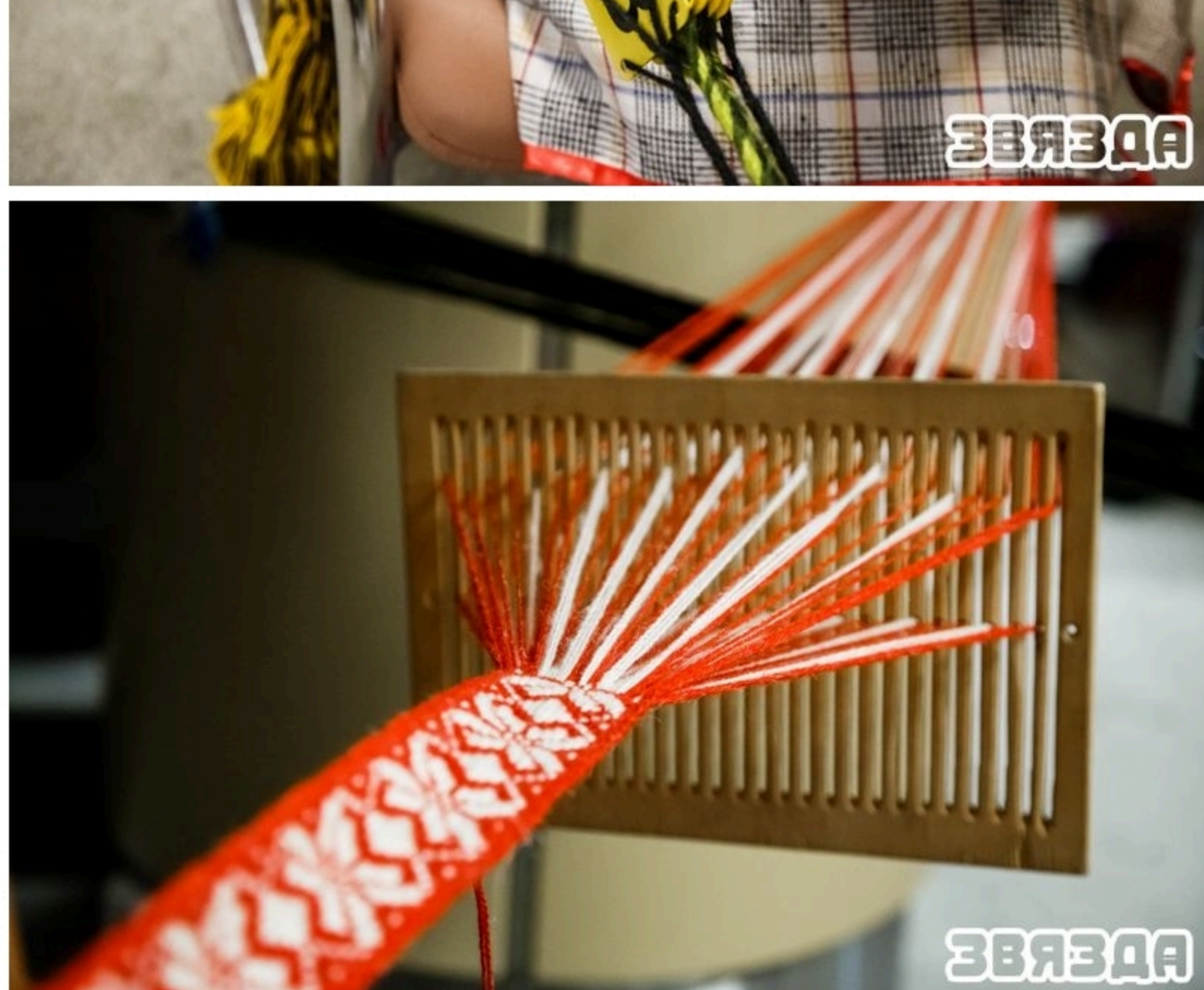
Трыма нагадаць, што наведаць выставу «Жывыя крыніцы» усе жадаючыя могуць да 23 ліпеня. На ёй прадстаўлена каля 500 экспанатаў са ўсіх рэгіёнаў Беларусі. Апошні, дваццаты, майстар-клас у межах гэтай выставы адбудзецца 14 ліпеня (выраб адкаратыўнага паясу ў тэхніцы «росліс па шыльце»).