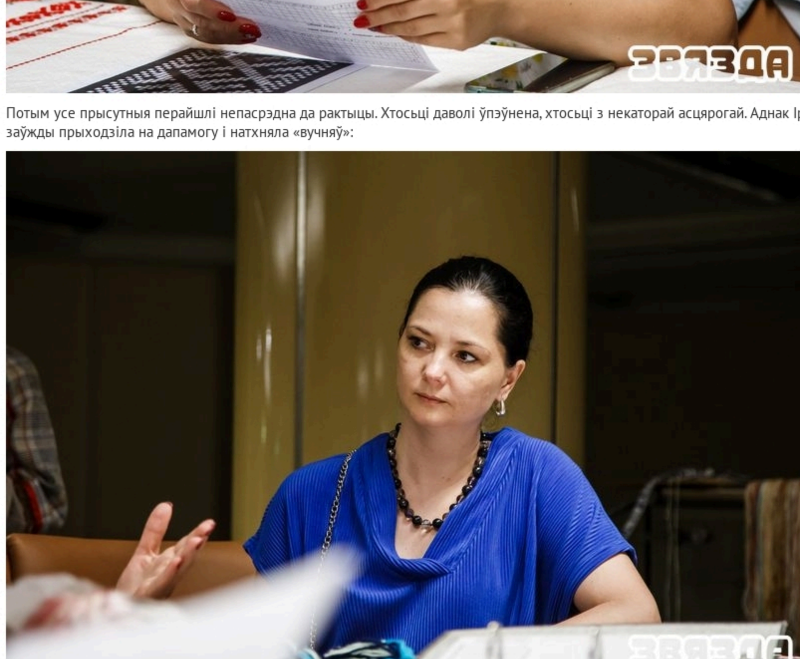
«Калі хлопцы насілі мазоль налева, ён быў жанаты, калі направа — жанаты, калі пасярэдзіне — удавец», — распавядала майстар.