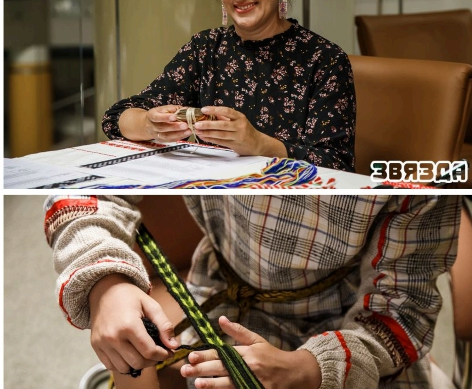
«Самае гапоўнае, каб вы разумеці, што вапсы паясы індывідуальныя, адзінка ў сваёй».