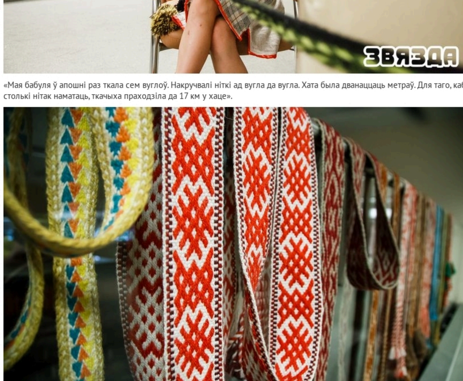
«Мая бабуля ў апошні раз ткала сям вузлаў. Накручвалі нітку ад вузла да вузла. Хаця была дванаццаць метраў! Для таго, каб ствольнік нітка наматваць, ткачыца праходзіла да 17 км у хвіліну».