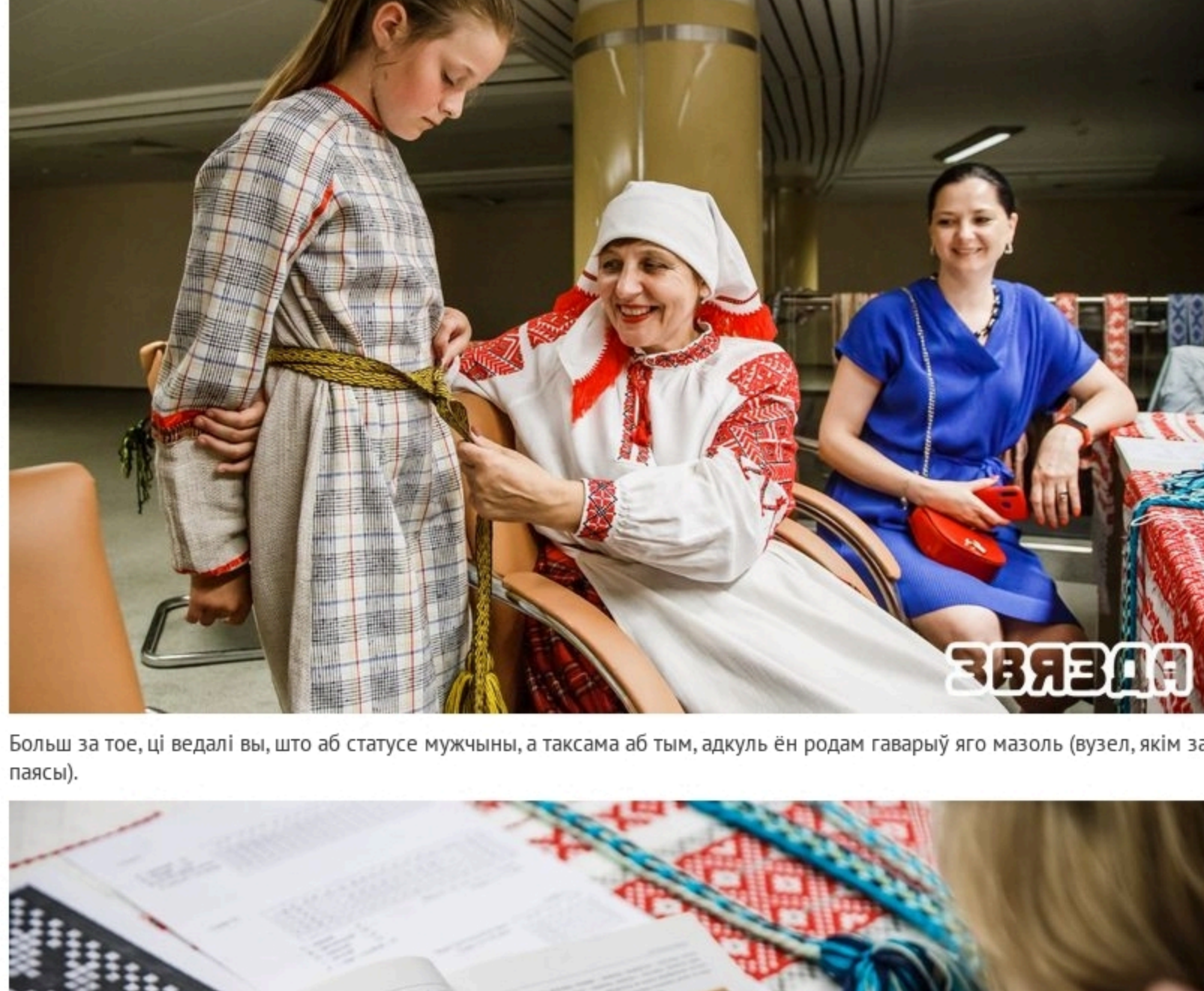
Таксама Ірына распавяла пра адрозненні дызайну паясоў у розных рэгіёнах Беларусі. Па яе словах, Брэстчына больш квітністая, а Гродзеншчына наадварот — спайкойная. Але ж нават у суседніх вёсках паясы маглі мець свае асаблівасці і быць зусім не падобнымі паміж сабой. Тэхніка захоўвалася ў сакрэце і, напрыклад, для жыхароў Гродзеншчыны было б вялікім горам, калі б хтосьці з Мінска даведаўся аб тым, як яны вырабляліся свае паясы.