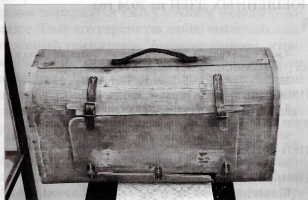
Дарожная скрыня Паўлюка Труса. З фондаў Уздзенскага раённага гісторыка-краязнаўчага музея.

З 1960 г. Цэнтральная раённая бібліятэка Уздзенскага раёна носіць імя Паўлюка Труса. Літаратурная гасцёўня “У Паўлюка”, створаная ў 2015 г., стала своеасаблівым брэндам установы. Гэтаму садзейнічала вялікая пошукова-даследчая праца, якая доўжылася не адзін год. Бібліятэкай назапашаны немалы вопыт краязнаўчай працы, не адно дзесяцігоддзе яе спецыялісты збіралі дакументы пра жыццёвы і творчы шлях паэта: кнігі, артыкулы, фотаздымкі, аўдыявізуальныя матэрыялы. Была створана тэматыч-