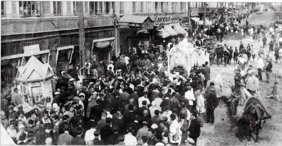
Пахаванне Паўлюка Труса ў Мінску. 1929 г. з фондаў Беларускага дзяржаўнага архіва-музея літаратуры і мастацтва.

ная папка “Песню славіў жыццё”, прысвечаная паэту, якая ўвесь час папаўняецца новымі матэрыяламі з газет і часопісаў. У гасцёўні можна пазнаёміцца з кнігамі П. Труса 1920–1930-х гг. Захоўваецца тут выданне “Вершы” з аўтографам сястры паэта Веры Адамаўны Трус ад 27 жніўня 1959 г. Трусаўскі фонд бібліятэкі папаўняецца дзякуючы супрацоўніцтву з абменна-рэзервовым фондам Нацыянальнай бібліятэкі Беларусі.