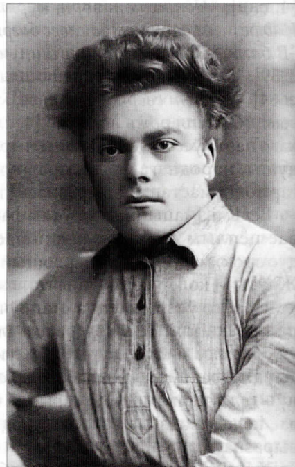
На адвароце здымка дарчы надпіс: «Адаму Бабарэку на добрую памяць ад сябра Усебеларускага аб'яднання паэтаў і пісьменнікаў “Маладняк” П. Труса. Закалосіць свабодным уздымам маладога жыцця акіян. 24/Х 25 г.».

Бацькі паэта былі непісьменнымі сялянамі, у сям’і лічылася, што навука дзецям непатрэбная, але Паўлюк цягнуўся да вучобы. У вясковай школе хлопец здзіўляў настаўніка стараннасцю і кемлівасцю. Акрамя паэтычнага таленту