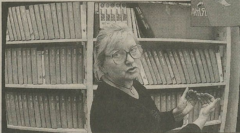
Только в Национальной библиотеке можно найти все книги серии «Память».

или ставших жертвами войны на территории тогдашней БССР. Почин благой, странно только, что индигированный более чем через четверть века после Дня Победы. Поздно вато спохватились, но, как говорится, лучше поздно, чем никогда. Мои предки родом почти из одной местности, но ныне эта территория входит в состав двух районов — Слуцкого и Осиповичского. Каково же было мое удивление, когда в книгах по этим районам я нашел множество знакомых имен, — сейчас самое дело заняться их «распознаванием»: где родственники, а где случайные однофамильцы. Многие родственники мои уже ничего не поведают даже о годах войны, не говоря уже о более ранних временах. Поэтому вся надежда в деле восстановления семейной родословной на «Памяць». Но вот проблема: а где же ее взять, «Памяць» эту?