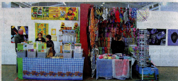
Дзве гандлёвыя кропкі ў межах выставы — праект Руслана Вашкевіча.

Руслан Вашкевіч прапанаваў перанесці гэтую дыскусію ў галіну творчасці. У межах выставы ён размясціў дзве гандлёвыя кропкі, на якіх рэальныя ІП прадаюць