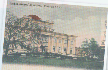
Замак князя Паскевіча. Пачатак XX ст.