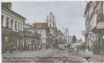
Мінск. Крамы на рагу Губернатарскай вуліцы і Саборнай плошчы. Пачатак XX ст.