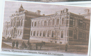
Гомель. Мужыцкая гімназія. Пачатак XX стагоддзя.