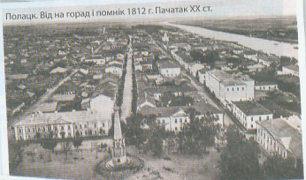
Палесце. Від на горад і помнік 1812 г. Пачатак XX ст.