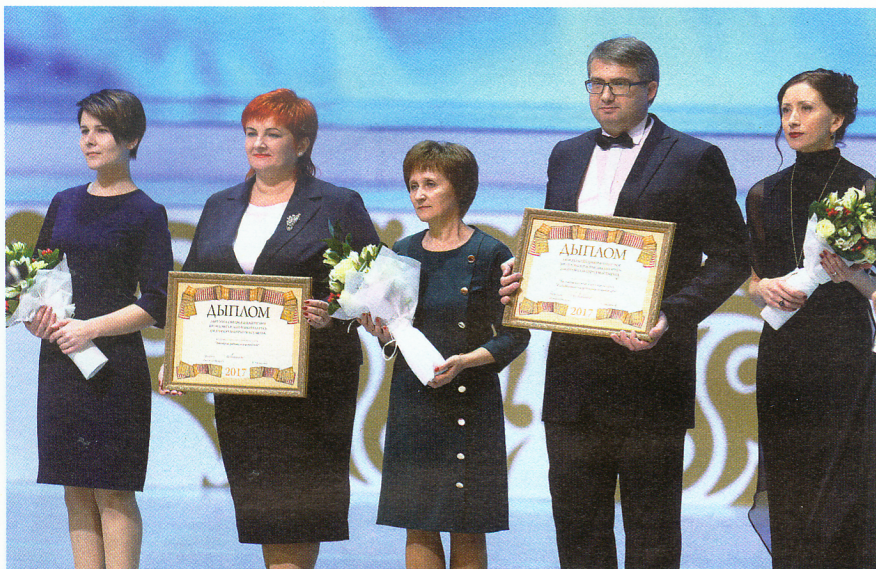
Лаўрэаты спецыяльных прэміяў Прэзідэнта Рэспублікі Беларусь дзеячам культуры і мастацтва

гледжання мастацтва, маралі, творчасці, культуры ў цэлым, духоўнасці? Нам вельмі хацелася б, каб ён быў заснаваны на знаёмых для нас традыцыйных ісцінах. Нам было б так прасцей. Але хто стане сцвярджаць, што так будзе? Ніхто! Мы будзем, вядома, змагацца, каб гэтыя традыцыйныя каштоўнасці захаваць. Нам яны падаюцца фундаментальнымі. Яны не проста духоўныя, яны святыя. Мы будзем да гэтага імкнуцца. Але ці атрымаецца?