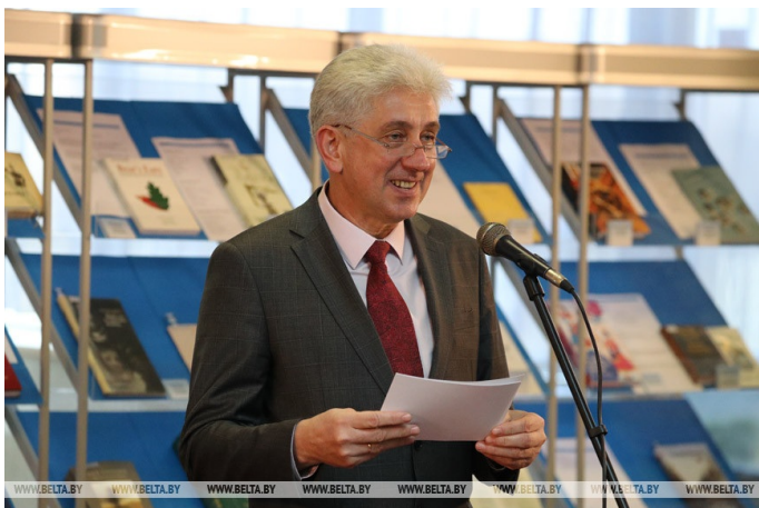
Директор Национальной библиотеки Беларуси Роман Мотульский