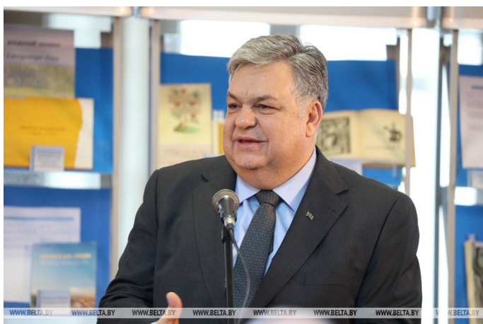
Чрезвычайный и Полномочный Посол Азербайджана в Беларуси Латиф Гандилов

Международный день родного языка, который отмечают с 2000 года, провозглашен ЮНЕСКО с целью защиты языкового и культурного многообразия, а также для обеспечения возможности более полного знакомства с языковыми и культурными традициями по всему миру.-0-