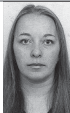
Главный библиограф Национальной библиотеки Беларуси