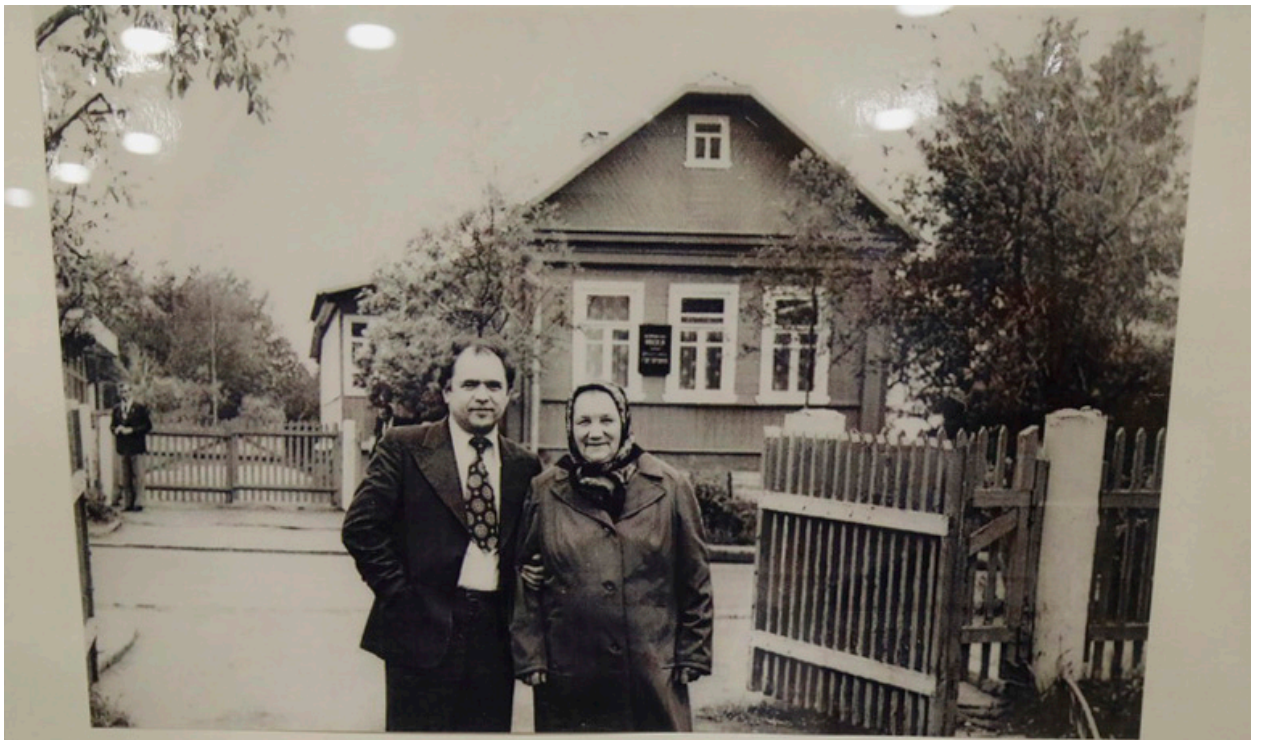
НИКОЛАЙ ЧЕРГИНЕЦ С МАТЕРЬЮ ПЕРВОГО КОСМОНАВТА ЮРИЯ ГАГАРИНА АННОЙ ТИМОФЕЕВНОЙ У ДОМА-МУЗЕЯ Ю.А.ГАГАРИНА 1980 ГОД