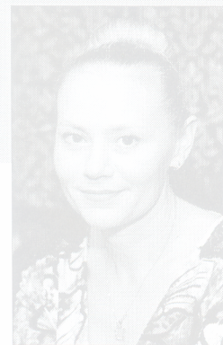
Дырэктар Научной библиотеки Белорусского национального технического университета, Председатель Совета ББА