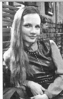
Заведуючая сектаром Нацыянальнай бібліятэкі Беларусі