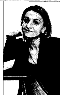
Заведующая сектором Национальной библиотеки Беларуси

Выбор способов представления и реализации интернет-ресурсов, решение организационных и технических задач, привлечение интереса широкого круга читателей на интернет-портал – все это задачи, решаемые в едином процессе работы взаимосвязанных специалистов библиотеки от библиографа до инженера-программиста.