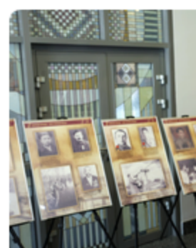
22 апреля 2025 г. | К В Минске откр "Единство нар Великой Побе