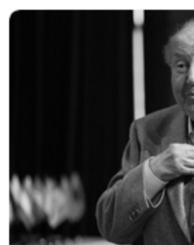
22 апреля 2025 г. | К Ушел из жизни — великий худ скульптор