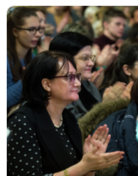
17 апреля 2025 г. | К В Ростове про патриотически "Завтра была