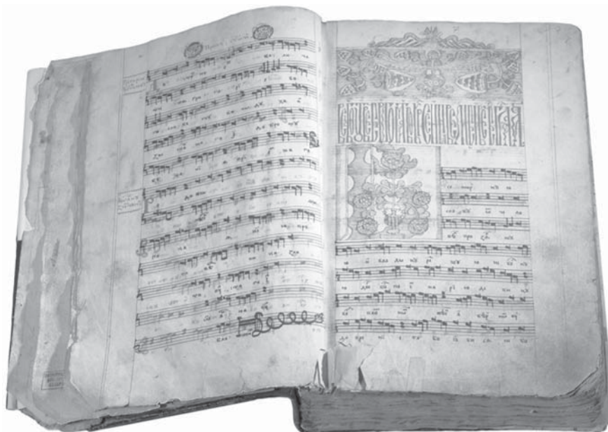
Ноталінейны ірмалой. Беларускі рукапіс. 1778 г.

Храналагічныя крытэрыі: старадаўнасць аб’екта, якая вызначаецца працягласцю часовага інтэрвалу паміж датай стварэння аб’екта