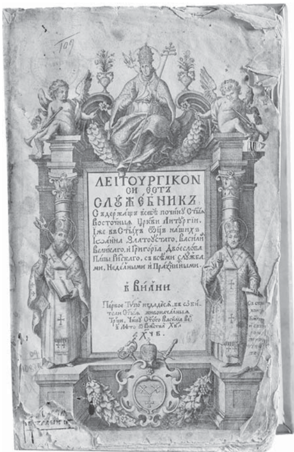
“Літургікон, або Служэбнік” з гравіраваным тытульным аркушам. Вільня – Супрасль. 1692–1695 гг.