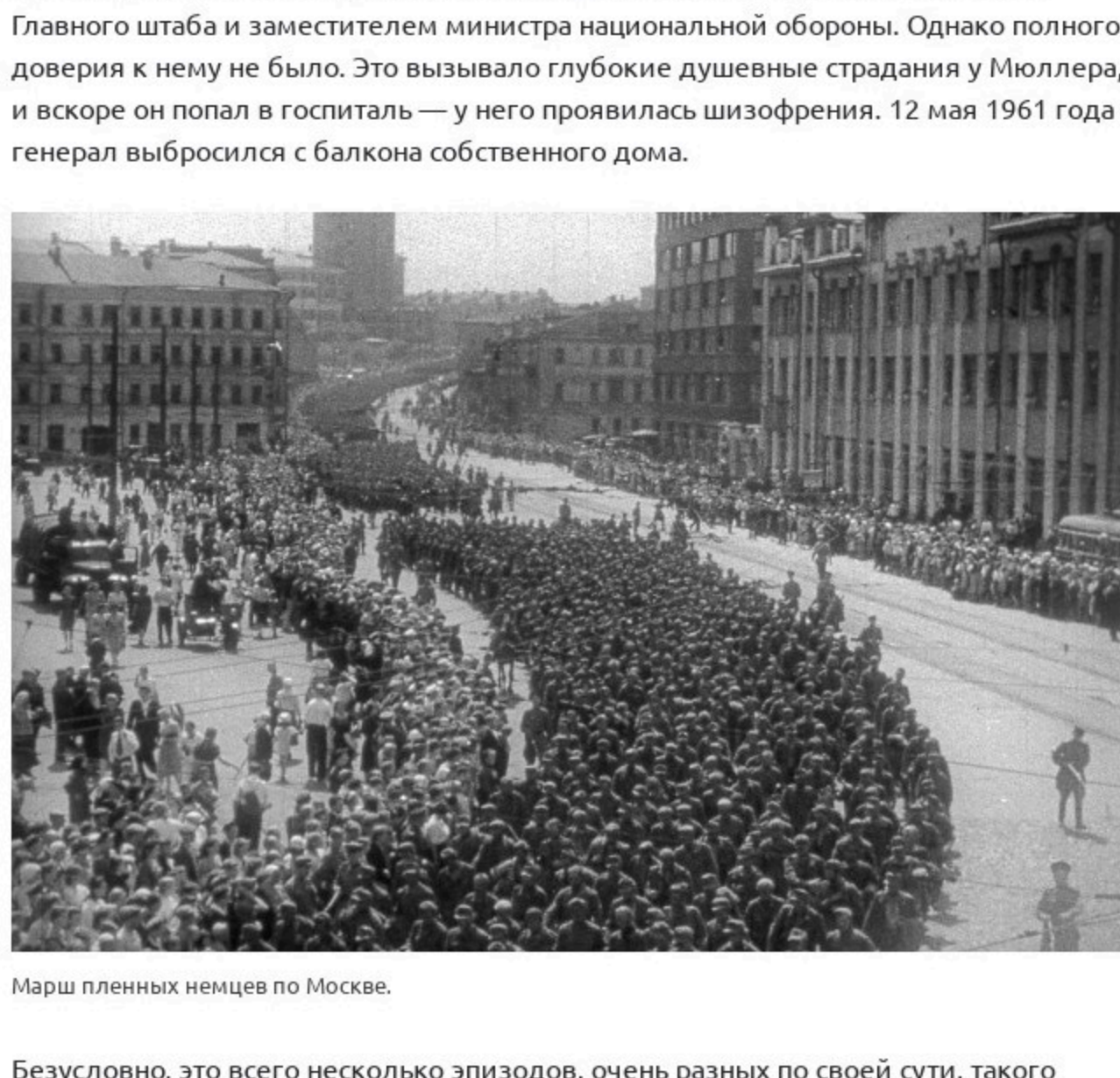
Марш пленных немцев по Москве.

Безусловно, это всего несколько эпизодов, очень разных по своей сути, такого масштабного события, каким стала операция «Багратион».