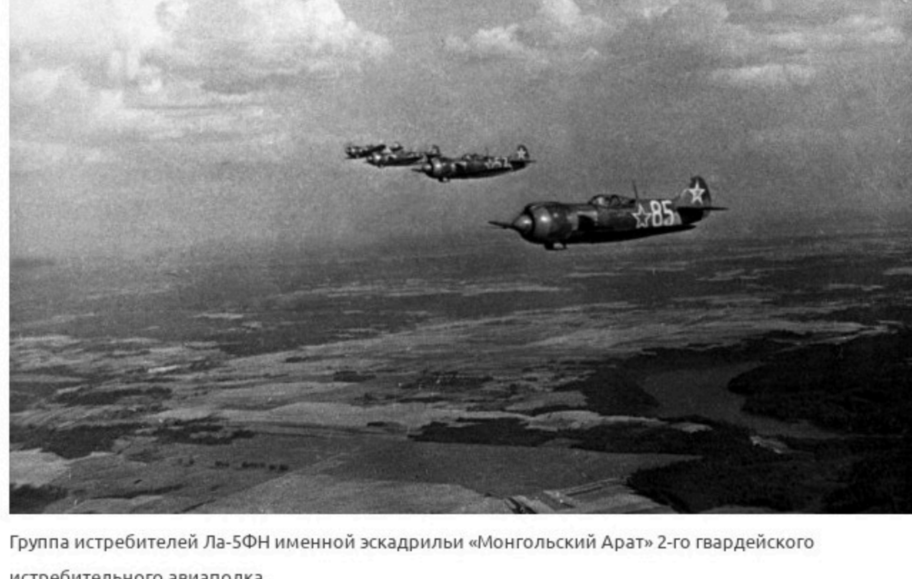
Группа истребителей Ла-5ФН именной эскадрильи «Монгольский Арат» 2-го гвардейского истребительного авиаполка.

В нашем небе тогда совершало боевые вылеты еще одно интернациональное подразделение — 2-я истребительная авиационная эскадрилья «Монгольский арат». Она была создана на средства, собранные трудящимися Монгольской Народной Республики.