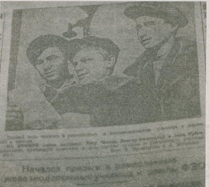
Газетная нататка аб фабзайцах