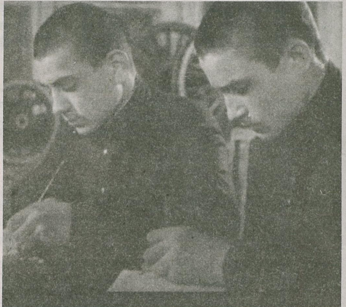
Навучэнцы школ ФЗН